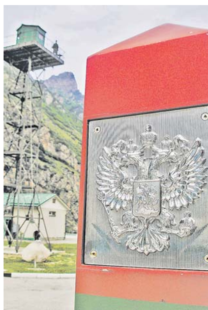
Граница на замке.

Через два часа открывшаяся взору красивейшая высокогорная долина, переходящая в ледник, заставила забыть о неудобствах пути. На небольшом плато у входа в ущелье расположился пограничный пост — застава в миниатюре со всеми