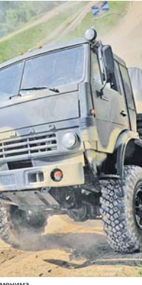
Для повышения мастерства военных водителей в Вооружённых Силах России ежегодно проводится

беле совершенна и комфортна, но нередко в экстремальных условиях военные водители, так же как их предшественники, совершают мужественные поступки и испытывают значительные трудности. Но с задачами справляются, что убедительно подтверждают тысячи километров, пройденных ими по жарким сиринским пустыням ради оказания помощи персоналу этой арабской страны.