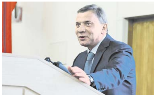
Вице-премьер Юрий БОРИСОВ с лекцией в Военной академии Генштаба.