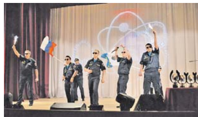
Служивым не занимать находчивости и умения повеселиться.

Состоялся финал игр Клуба весёлых и находчивых среди команд воинских частей 12-го Главного управления Минобороны России