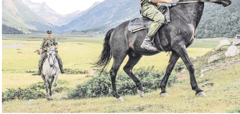
Без лошадей патрулировать труднодоступные районы границы невозможно.

— На границе есть такие места, куда кроме как на лошади не добраться, — пояснил собеседник. — Так что лошади и сегодня, в век современных технологий и вооружений, остаются первыми и порой незаменимыми помощниками.