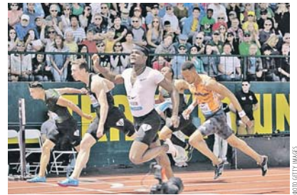
Сергей ШУБЕНКОВ (второй слева) уступил только Омару МАКЛЕОДУ.

Действующий же чемпион мира в помещении в прыжке в высоту Данил Лысенко с результатом 2 метра 32 сантиметра занял второе место в своём секторе. Армейец все высоты брал с первых попыток, но рубёж 2,34 остался неприступным. Победителем в Юджине стал Мутаз Баршим из Катара, которого наш соотечественник победил на зимнем мировом первенстве в британском Бирмингеме. Катарец отметку 2,34 пропустил, а плану на 2,36 преодолел с третьего раза, заработав очередные 8 баллов. Атака на 2,42 уже в качестве победителя турнира сложилась неудачно. Китаец Ю Ван замкнул тройку призёров с таким же результатом, как у Лысенко (2,32), но уступил Лысенко по количеству попыток.