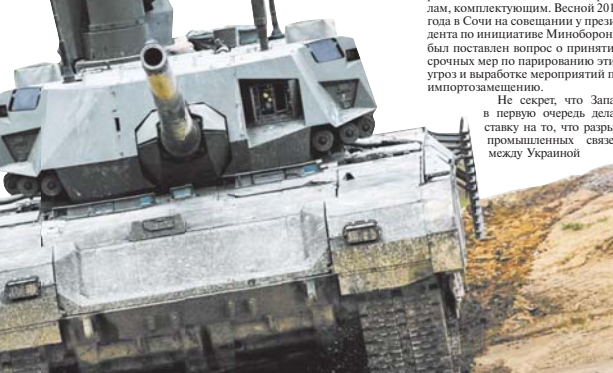
ГПВ перешла на контракты длительного цикла изделия.

В среднем типаж уже уменьшился на несколько процентов, а на перспективно-готовых — от 10 до 15 процентов. Тем не менее достичь современности в этом направлении — это