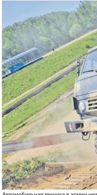
Автомобильная техника в армии незаменима.

В этой связи к профессиональным качествам военного водителя предъявляются самые высокие требования. Человек за рулём армейского автомобиля должен не только быть выносливым и совершать многокилометровые марши в составе автомобильной колонны, в опасных дорожно-транспортных ситуациях и в условиях активного воздействия противника, в том числе высокоточным и химическим оружием, но и уметь оказывать помощь при оказании помощи персоналу этой арабской страны.