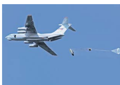
Десантирование боевой техники.

Кроме того, в войска поступили новейшие образцы техники связи и АСУ, беспилотные летательные аппараты и средства оптико-электронной и воздушной разведки «Таксион», «Орлан-10» и «Элерон-3», комплексы АСУ «Дозор». Строительство и развитие Воздушно-десантных войск, как известно, осуществляется в качестве основы войск быстрого реагирования. А увеличение боевых возможностей ВДВ было достигнуто за счёт совершенствования организационно-штатной структуры и системы управления войск, ос-