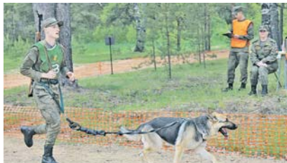
Военнослужащие и собаки соревнуются вместе.

По сложившейся традиции конкурс кинологов в городах приписан к 470-й учебный центр служебного собаководства Вооружённых Сил РФ в Дмитровском районе Московской области. Участниками этого этапа стали победители третьего (оружейного и видовой) этапа кинологовического конкурса «Верный друг», который проходил в середине мая в четырёх военных округах, а также на Северном флоте, в ВКС, РВСН, ВДВ и центральных органах военного управления.