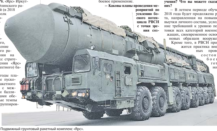
Подвижный грунтовый ракетный комплекс «Ярс».

— Каковы планы проведения мероприятий по усилению боевого потенциала РВСН с точки зрения создания