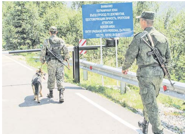
Для несения службы в горно-лесистой местности необходима специальная подготовка.

тейшим месторождениям нефти и других полезных ископаемых. Сегодня Архыз, Домбай, Теберда и многие другие заповедные места манят своей красотой и обещают незабываемый отдых. Вместе с тем эта южная оконечность России нередко является предметом устремлений незваных гостей, цели которых совсем иного рода.