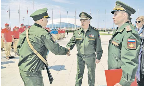
Во время торжественной церемонии.