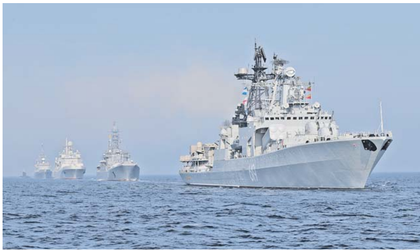
Отряд кораблей российского флота во главе с большим противолодочным кораблём «Североморск».

Сегодня личный состав Военно-морского флота достойно продолжает летопись, начатую более трёх веков назад. Надводные корабли, подводные силы, береговые войска и морская пехота, а также морская авиация успешно выполняют учебно-боевые задачи, эффективно отстаивая интересы государства в Мировом океане. Подтверждением высокой готовности ВМФ к выполнению задач любого уровня сложности стали масштабные учения в Восточной части Средиземного моря. В ходе них было выполнено около 60 боевых упражнений с практическим применением оружия, в том числе около 20 ракетных стрельб, около 30 артиллерийских стрельб и более 10 упражнений с применением морского подводного оружия. Отмечу участие сил ВМФ в крупномасштабных манёврах «Восток-2018», где было задействовано свыше 60 кораблей от 20 соедине-