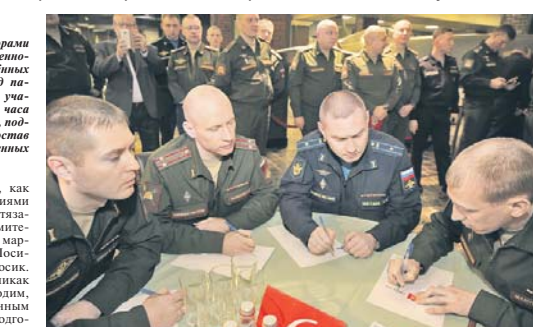
Идёт обсуждение вопроса.