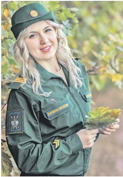
ФОТО ОЛИИ НЕКРОС