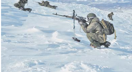
Традиционной площадкой для тренировок разведчиков по горной подготовке выступают два вулкана.

Первая разведывательная рота Камчатской отдельной бригады морской пехоты завоевала звание ударной, повторив прошлогодний успех