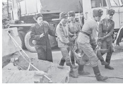
Спитяк, 1988 год.

Возвратиться на базу после одиночного рейса, как правило, не удавалось. Экипаж получал новое