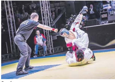
До победы остались секунды.