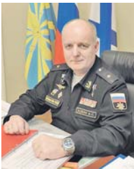
Генерал-майор Игорь КОЖИН.

На первом этапе (до 2020 года) осуществляется активная модернизация существующего парка воздушных судов. Речь идёт о замене воздушных судов специальной авиации на новые образцы, включение в боевой состав подразделений корабельной истре-