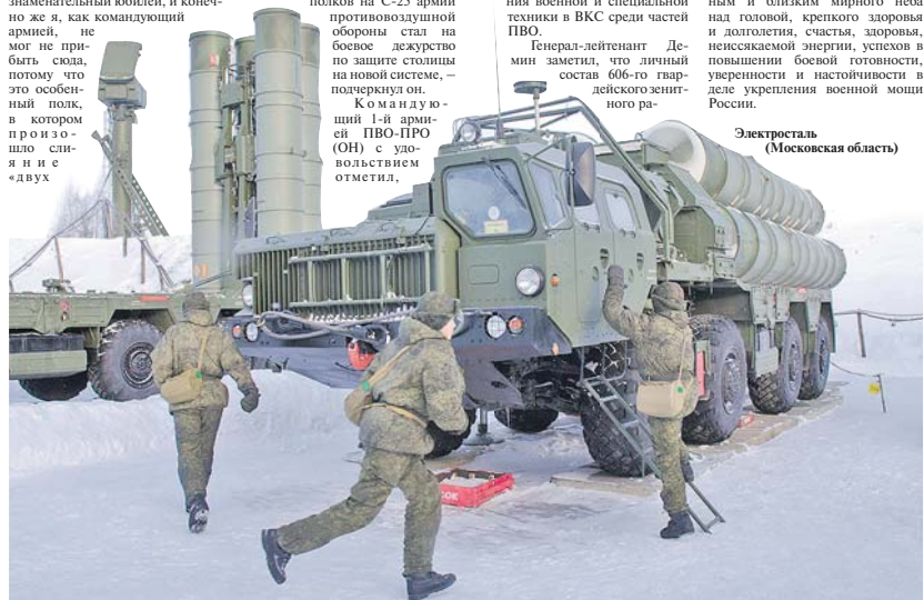
Когда звучит сигнал «Тревога».