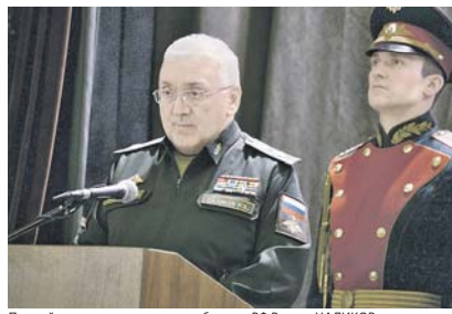
Первый заместитель министра обороны РФ Руслан ЦАЛИКОВ.

Поднять служителей Фемиды с вековым юбилеем прибыл первый заместитель министра обороны РФ Руслан Цаликов, который читал поздравительный адрес от имени министра обороны