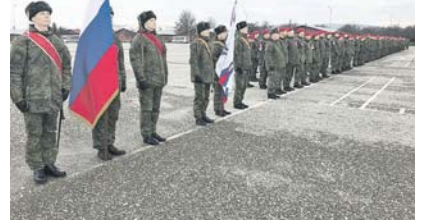
Торжественный митинг на территории мотострелкового полка ЮВО.