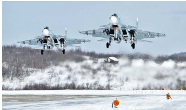
Боевые будни морских лётчиков.

полнение. Как идёт становление лётаного?