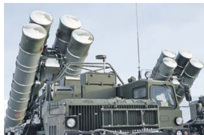
Пусковые установки ЗРС С-400 приводятся в боевое положение.