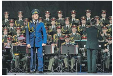
Во время концерта.

С гастролью в Польшу ансамбль Александрова вылетел в декабре 2018 года уже двадцать вторые по счёту. В дни своего юбилея Академический ансамбль песни и пляски Российской Армии имени А.В. Александрова даст концерты в семи городах. Это Быдгощ,