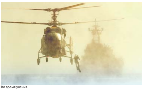
Во время учения.

Морская авиация ВМФ наращивает усилия по совершенствованию подготовки лётного состава