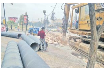
В Алеппо идёт восстановление водоснабжения.

Эксперты указывают на неизбирательный характер ударов авиации и артиллерии, под огнем которых попадают не только позиции боевиков, но и дома мирных жителей. Значительная часть зданий в Хаджне серьезно повреждена или разрушена, в том числе несколько больниц. Имеются данные о десятках убитых мирных жителей, ставших жертвами авиаударов. Судя по всему, Хаджна ждет печальная судьба Раки.