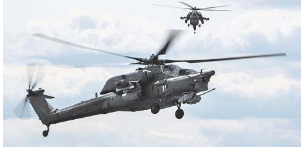
На дежурстве «Ночной охотник».