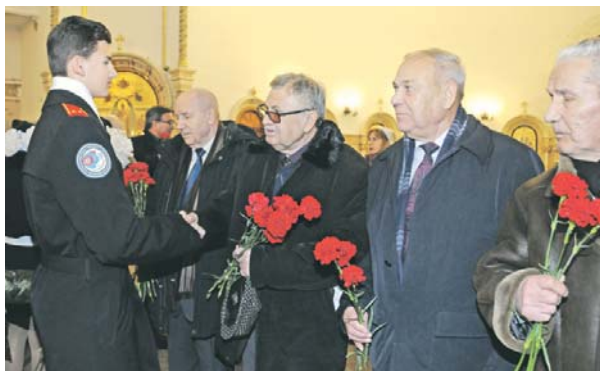
На торжественной службе в храме.

В Москве состоялось богослужение в честь 100-летия со дня образования военной контрразведки ФСБ России