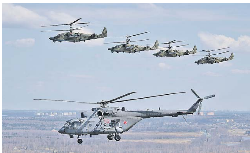
В небе — звено «Аллигаторов».