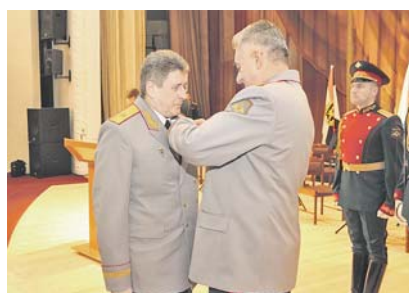
Начальник Военной академии Генерального штаба Вооруженных Сил РФ генерал-полковник Владимир ЗАРУДИЦКИЙ вручит отличившимся офицерам государственные награды.

Почетное право открытия мемориальной доски этому заслуженному военному руководителю XIX века было предоставлено начальнику Военной академии Генерального штаба Вооруженных Сил Российской Федерации генерал-полковнику Владимиру Заруд-