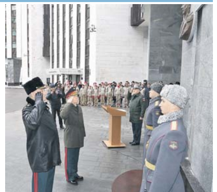
Открытие мемориальной доски.