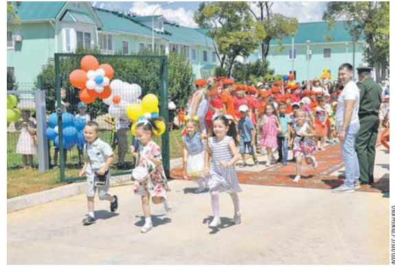
Дети российских военнослужащих не скрывают своей радости.