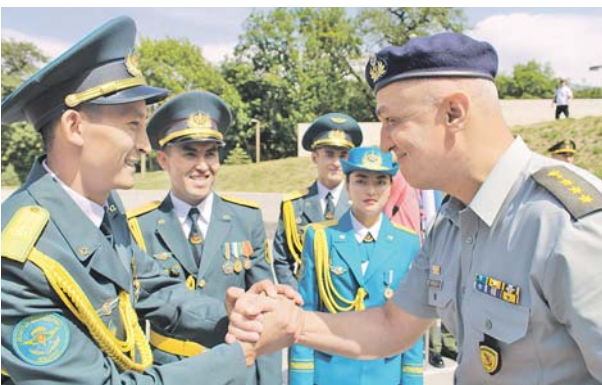
В Дилижане пройдёт самый творческий конкурс военных профессионалов.

Александр АЛЕКСАНДРОВ * Команда в составе избранных представителей от вооружённых сил на конкурс «Воин мира» в этом году направила всего шесть стрел. Зато как! Международный этап состязаний в рамках АрМИ-2019 прошёл в горном Дилижане — важнейших ключевых регионов Евразии: Армении, Белоруссии, Греции, Ирана, Казахстана и России. Все они лучшие воины своих армий, завоевавшие право представлять страну в финале мировых состязаний.