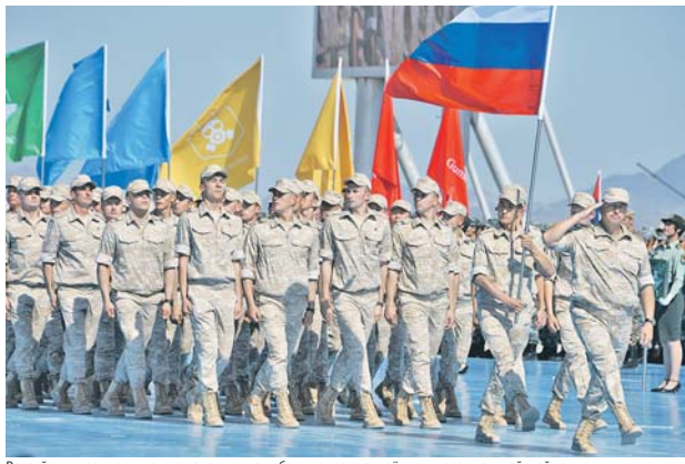
Российские военнослужащие нацелены на победу во всех четырёх конкурсах на китайской земле.

С учётом разницы во времени раньше всех других стран-организаторов Армейским международным играм – 2019 дали старт в Китайской Народной Республике