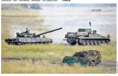
Конкурс «Рембат» — один из самых насыщенных по задействованной технике.

и её границ», — отметил заместитель министра обороны, поздравляя черноморцев в вручении новой награды. По его словам, бригада четвернадцатилетнею отличилась в соединении ВМФ, а личный состав всегда демонстрировал высокий профессионализм, действовал нестандартно и самоотверженно, зачастую рискуя собственными