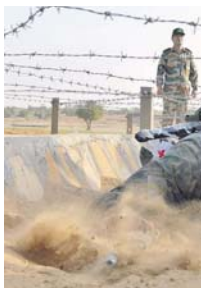
В индийской пустыне всем приходится несладко.

— Напрямую? — Посадка в вертолёт и высадка из него. — Расскажите подробнее, с чем это связано. — С техниками особенно тяжёлыми вертолёта. В соревнованиях будет использоваться транспортный вертолёт индийской БВС «Дхрув», разработанный индийской национальной компанией HAL при поддержке германского концер-