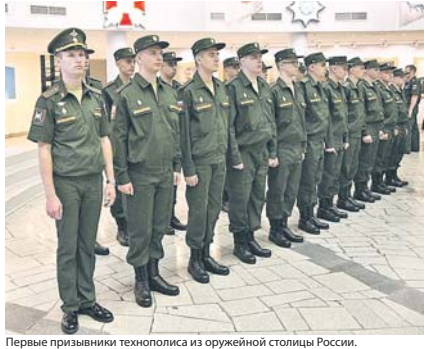
Первые призывники технополиса из оружейной столицы России.