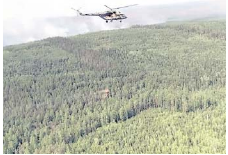
В тушении пожаров участвуют вертолёты Ми-8 водосливными устройствами.

Кроме того, военное казначейство ЦВО совместно с сотрудниками МЧС и Росгвардии доставила в посёлок Октябрьский-2 Иркутской области, который оказался отрезан-