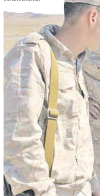
Ещё есть время обсудить вопросы, касающиеся проведения конкурса.

С оглядкой на погоду, хотя и в меньшей степени, действуют и расчёты с комплексами беспилотных летательных аппаратов, выступающих в конкурсе «Сокolina охоты». Здесь сложность представляют не только высокие температуры воздуха, но и порывы ветра. Надо понимать, что летательный аппарат – это не самолёт на турбореактивной тяге: изменение скорости потоков воздушных масс может повлиять на его полёт вполне ощутимо. Не случайно программой соревнований предусмотрено, что в случае экстремального усиления ветра запуска ки БПЛА могут быть приостановлены.