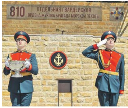
Новый символ воинской доблести будет храниться на самом видном месте подле Боевого Знамени соединения.

Полковая чаша Министерства обороны Российской Федерации вручена соединению морской пехоты Черноморского флота