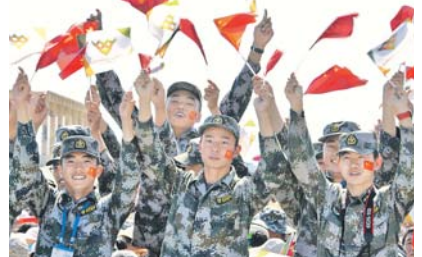
Хозяева соревнований тепло приветствуют гостей.

«Пусть атмосфера Игр покажет всему миру через дух спортивных состязаний настоящую дружбу наших армий и стран, и в первую очередь миролюбивый настрой», – подчеркнул глава российской военной делегации. «Скоро всем участникам спортивного азарта, уверенности в победе, а народам