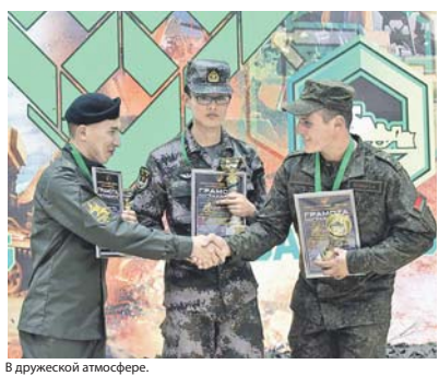
В дружеской атмосфере.

День открытия Игр в Западной Сибири ознаменовался необычными стартами. В частности, конкур-