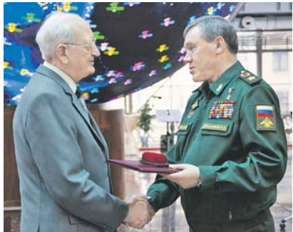
Лауратов награждает начальник Генерального штаба ВС РФ.

Победители получили из рук начальника Генерального штаба Вооруженных Сил РФ генерала армии Валерия Герасимова дипломы, почётные знаки и денежную сумму в размере 200 тысяч рублей.