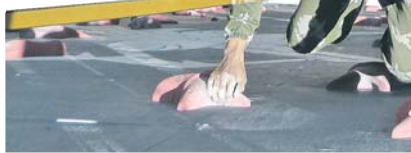
Скалодром заставляет участников демонстрировать особые навыки.

Свое ловкость и альпинистские навыки команды демонстрировали на отвесной вертикальной стенке скалодрома высотой 15 метров