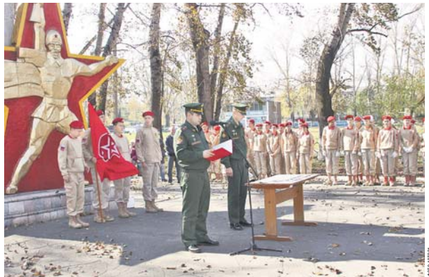
Ряды амурских юнармейцев пополняются подростками из Белогорского и Серышевского районов.

Сегодня желаний продолжить службу по контракту становится всё больше, следовательно, появляются в высшие учебные заведения Министерства обороны РФ.