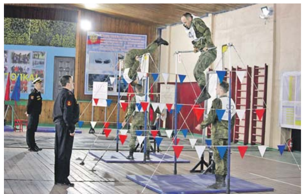
На чемпионате БФ по военному четырёхборью.