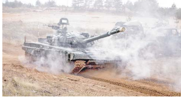
На танковой директрисе.