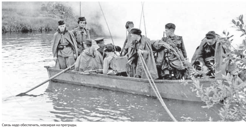
Связь надо обеспечить, невзирая на преграды.