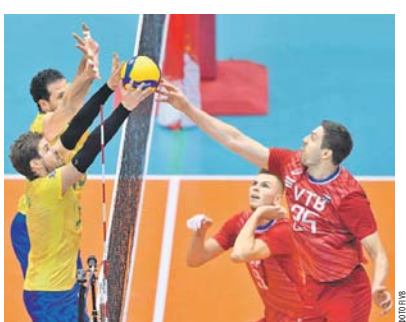
За девять месяцев до Олимпиады-2020 наша команда не впечатлила болельщиков своей игрой.

биться за награды. Какая уж тут психология? Итог — шестое место. Пьедестал заняли Бразилия, Польша и США. Кубок мира оставил один главный вопрос: стоит ли допускать, чтобы сборная представляла перед всеми в таком свете? Уж тем более за девять месяцев до Олимпиады в Токио.