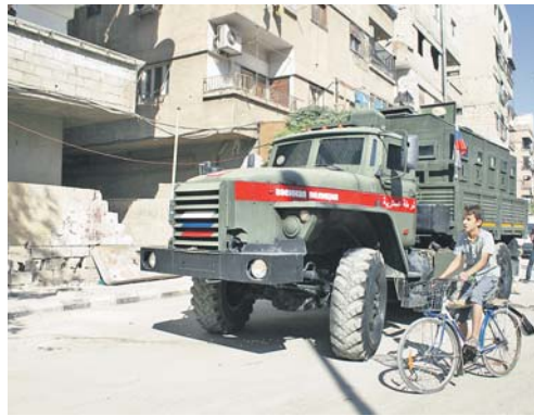
Российская военная полиция обеспечивает правопорядок в сирийских городах.

На северо-востоке САР в результате начавшейся военной операции Анкары и без того тяжёлая гуманитарная ситуация продолжает ухудшаться. Продвижение турецких войск привело к исходу