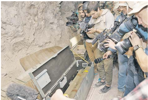
Убежища террористов в пещерах южного Идлиба.

«В российском военном ведомстве ознакомились с публикацией американской газеты «Нью-Йорк таймс» о якобы удержании российских пилотов в сирийских осетианах. Прежде всего хотели бы выразить сожаление, что серьёзное издание стало жертвой манипуляций со стороны террористов и британских спецслужб», — заявил в понедельник официальный представитель Минобороны России генерал-майор Игорь Кошаченков.