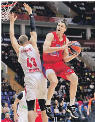
На старте сезона красно-синие привыкают к новым реалиям.