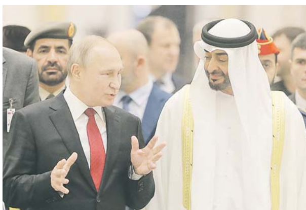
Президент РФ Владимир ПУТИН и наследный принц Абу-Даби Мухаммад Аль НАХАЙЯН. Объединённые Арабские Эмираты. Абу-Даби.