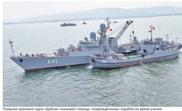
Плавучее крановое судно «Дубняк» оказывает помощь «повреждённому» кораблю во время учения.

Кроме того, кораблями и судами противоминного и навигационно-гидрографического обеспечения были развёрнуты две опорные станции радиогидрографического комплекса «Крабик-БМ» и выполнен поиск подводных объектов «противника» с помо-