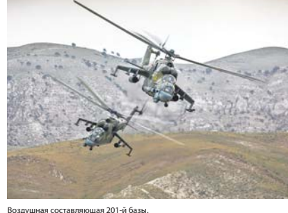
Воздушная составляющая 201-й базы.

Заслуживающих внимания нововведений в текущей практике курса боевой подготовки соединения