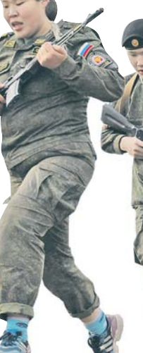
Воспитанники военно-патриотического клуба преодолевают полосу препятствий.