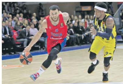
В следующем туре Евролиги ЦСКА сразится с «Барселоной».

На японском льду, как и ожидалось, успешно выступили наши девушки, возглавив список восходящих звезд солнца две награды. Вряд ли у кого-то возникли сомнения, что очередную победу одержит 16-летняя подопечная Этери Тутберидзе Алёна Косторная. В короткой программе японская фигуристка установила мировой рекорд — 85,04 балла, сняв все вопросы об исходе состязания. Конечно, не было равных Алёне и в произвольной. С суммой 240,00 балла она вышла на вершину пьедестала, одновременно с этим завоевав путёвку в финал. Даже сильная японка Рика Кихира с её трюмными акробатиками оказалась бессильна перед юной россиячкой. В дальнейшем сезоне вышло так, что воспитанницы «Хрустального» выиграли всё золото на шести этапах Гран-при. В упорной борьбе, поразив зрителей и судей произвольной программой, третья чемпионка олимпийских игр, чемпионка Пхёнчхана-2018 Алёна Загитова, что также позволило ей оказаться в числе фина-