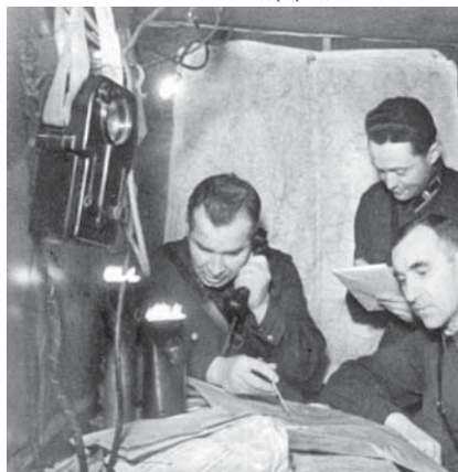
На КП 95-й стрелковой дивизии в Сталинграде.