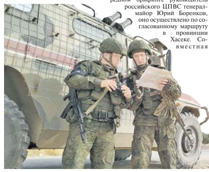
Российские военные полицейские тщательно отработывают маршруты патрулирования.