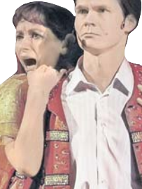
Мюзикл «Жар-птица» в постановке театра ВВО. Только исход в любом случае мрачен. Но из этого отсутствия малейшего позитива каждый зритель извлекает свой урок.