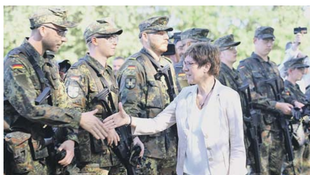
Аннегрет Крамп-Карренбаур пытается возродить в бундесвере боевой дух.

части идёт молодёжь из восточных земель, то есть из бывшей ГДР на уровень жизни ниже, чем на западе. В результате выходы из новых федеральных земель составляют