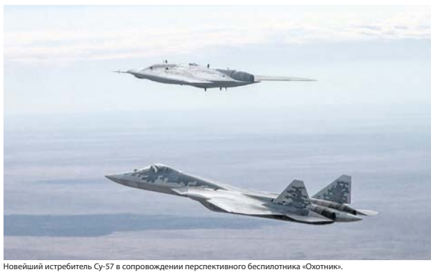
Новейший истребитель Су-57 в сопровождении перспективного беспилотника «Охотник».

Второе: важно совершенствовать систему управления военной организацией. Эта система должна быть современной, надёжной, многофункциональной, обладать передовыми информационно-аналитическими комплексами, сред-