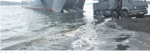
Учебно-боевая работа вдали от пункта постоянной дислокации.