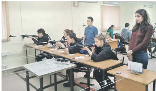
В тире ДЮСШ в тот день не было плохих стрелков.

В столице Республики Саха (Якутия) подвели итоги лично-командного первенства по пулевой стрельбе среди юнармейцев общеобразовательных организаций