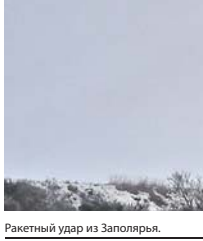
Ракетный удар из Заполярья.

100-километровый марш в глубь территории, который совершил дивизион, изобилует сложными участками и стал настоящим испытанием для большей части многоосной техники и механиков-водители.