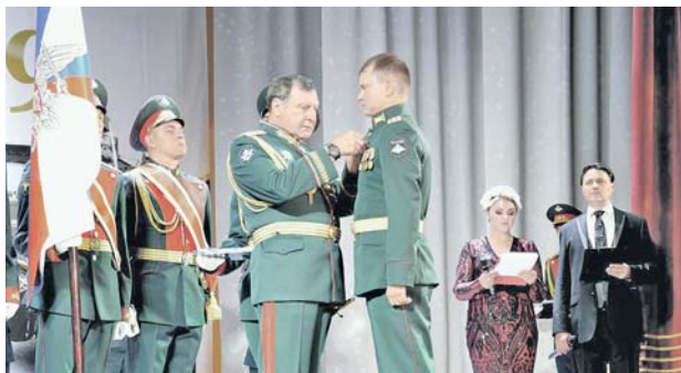
Награждение отличившихся военнослужащих ГАБТУ.

Открывая торжественную церемонию, правомерно: киев управления, заместитель министра обороны генерал армии Дмитрий Булгаков отметил особую значимость этой даты в истории российской Вооружённых Сил. В своём выступлении он подчеркнул, что, как бы ни именовалось оно в разные годы своего существования, неизменным оставалось одно — его выдающиеся заслуги перед Ро-