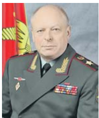
Генерал армии Олег САЛЮКОВ.

— Расскажите, пожалуйста, более подробно о СКНУ «Центр-2019». Каковы основные задачи Сухопутных войск в ходе этого учения? — С 16 по 21 сентября проведено стратегическое командно-штабное учение «Центр-2019», ставшее главным экзаменом для Вооружённых Сил РФ, в том числе и для Сухопутных войск. Такие масштабные мероприятия проводятся ежегодно поочередно в каждом военном округе. Одной из особенностей учения