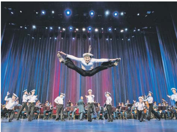
ансамблей песни и пляски Вооружённых Сил Российской Федерации. Он подчеркнул, что с пристальным вниманием репертуарных исполнителей военной массовой культуры — ансамбли

Непосредственно сам старт проведения своеобразной учёбы и обмена опытом руководства ансамблей дал в приветственном слове заместитель министра обороны РФ — начальник Главного военно-политического управления ВС РФ генерал-полковник Андрей Картаполов. Он на своём выступлении со слов, определяющих силу песенных культурных традиций в нашей стране, выдающегося русского композитора, автора музыки Гимна России, легендарной песни «Священная война» и многих других произведений, вошедших в золотой фонд отечественной культуры, родоначальника и основателя армейской музыкальной культуры Александра Васильевича Александрова. «Я никогда не был военным специалистом, но у меня всё же оказалось могучее оружие в руках — это песня. Песня, которая так же может развить врага, как и любовь», — подчеркнул Картаполов, отметив, что основная цель сборов — совершенствование системы функционирования и содержания