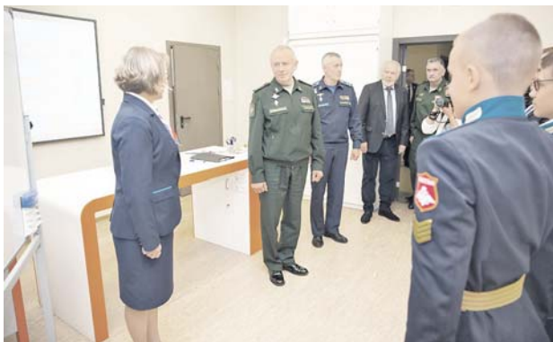
Посещение учебной аудитории Петрозаводского ПКУ.