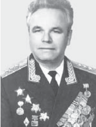
Маршал инженерных войск НИКОЛАЙ ШЕСТОПАЛОВ.

Под его руководством военное строительство в нашей стране обрело небывалые масштабы. Ему доверяли сложнейшие задачи государственной важности, которые выполнялись с исключительным качеством и в срок. Спустя 100 лет со дня рождения выдающегося военачальника его друзья, родственники, коллеги и соратники вспоминали маршала в ходе научно-практической конференции, организованной на базе Военной академии Генерального штаба ВС РФ по инициативе Департамента строительства Минобороны России и ветеранов военно-строительного комплекса.