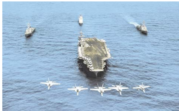
Авианосцы по-прежнему рассматриваются в США как инструмент обеспечения доминирования в Мировом океане.