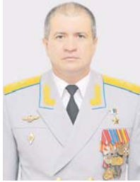
Генерал-лейтенант Сергей КОБЫЛАШ

Как одну из наиболее важных задач дальней авиации в мирное время хочется отметить выполнение полётов в воздушном пространстве над нейтральными водами в различных регионах