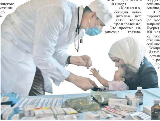
На приёме российских военных врачей.

Используя Россию прокладываются реализации полетов мемуранда о взаимопонимании, принятого совместно с Турцией 22 октября 2019 года. На севере Сирии продолжается патрулирование силами подразделений российской военной полиции по маршрутам Камышылы — электростанция