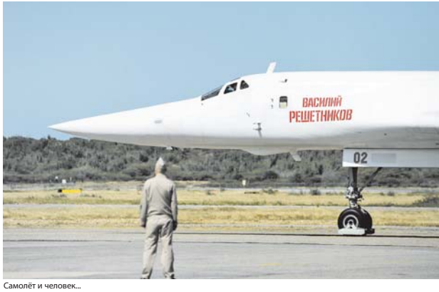
Самолёт и человек...

«О, как любил я летать! Физически и эмоционально испытывал чувство огромной радости, почти счастья от каждого полёта. Это на многие годы, далеко за послевоенные, было главным аргументом моей жизни... Но летать, как и жить, без боязни цели было бессмысленно, — сказал мне, прощаясь, Герой Советского Союза Василий Решетников. — Сейчас новое время, пришли новые люди, теперь им предстоит творить историю нашей великой страны. Я в них уверен, я ими горжусь».