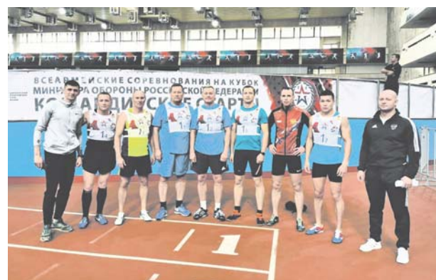
Участники эстафеты команды ЗВО на «Командирских стартах».

современования различного уровня. Преимуществом он отдаёт летнему офицерскому тире, в котором бег и стрельбу считают своими сильными сторонами: в каждом виде гвардеец может набрать тысячу и более очков. В спорте, как и в жизни, Нурмат придерживается простого принципа: делать то, что у тебя получается, и ты это можешь сделать хорошо. Подтверждение правильности такой жизненной установки