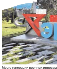
Место генерации военных инноваций – технополис «ЭРА».

Говоря о подготовке к следующему форуму, отмечу, что она начинается сразу после окончания текущего года. Это уже стало традицией. Для подготовки и проведения форума образован оргкомитет, в состав которого вошли руководители и