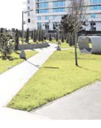
Место генерации военных инноваций – технополис «ЭРА».

В рамках второй составляющей системы инновационной деятельности осуществляется мониторинг инновационных разработок и технологий, отбор и экспертизу инновационных проектов и реализацию инновационных проектов.