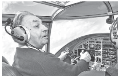
Руки держат штурвал по-прежнему крепко.