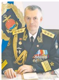
Адмирал Александр КОСАТОВ.