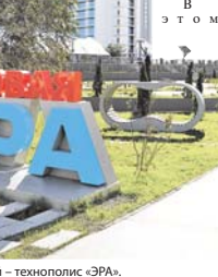
Место генерации военных инноваций – технополис «ЭРА».

— Для обеспечения развёртывания новых научно-исследовательских и опытно-конструкторских работ и реализации инновационных проектов требуется дальнейшее развитие инновационной инфраструктуры технополиса. С этой целью планируется организация эффективной работы дизайн-центров микроэлектроники