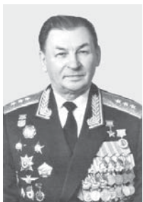
Генерал-полковник авиации Василий РЕШЕТНИКОВ.

В годы Великой Отечественной войны лётчик Решетников совершил 307 боевых вылетов, нанеся бомбовые удары по аэродромам, портам, органам управления,