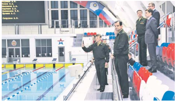
В бассейне Военного института физической культуры пройдут состязания по плаванию.

Санкт-Петербург готовится принять III Всемирные кадетские игры летом будущего года