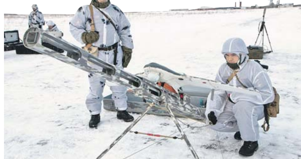
Беспилотник на стартовой позиции.

подразделений бригады, которые реально во время в других местах полигона. — Артиллеристы гаубичных дивизионов или реактивного артиллерийского проволот стрельбы, и мы совместно с ними выполняем. Они отработают свои задачи, а мы в их интере-