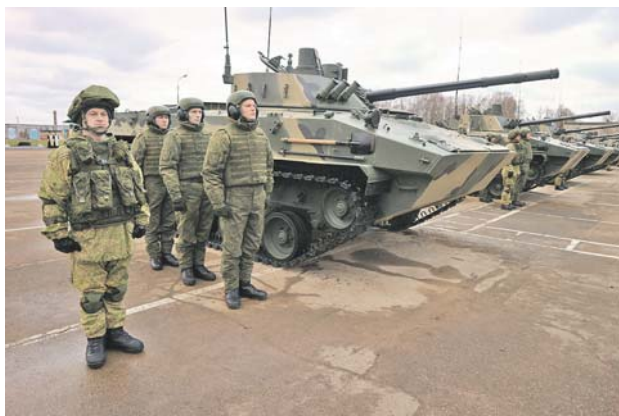
БМД-4М теперь в строю псковских десантников.

1 стр. Созданные конструкторами боевые машины повышают мощь Воздушно-десантных войск, которые стоят на страже национальных интересов России. Наши войска продолжают развиваться и совершенствоваться. С учётом спланированных поставок современных образцов бронетанкового вооружения и техники в 2020 году в соединения и воинские части ВДВ запланирована поставка ещё двух батальонных комплектов боевых машин. Оснащение войск современной техникой и средствами управления способствует повышению боевых возможностей подразделений ВДВ, а реализация заданий государственного оборонного заказа в интересах Воздушно-