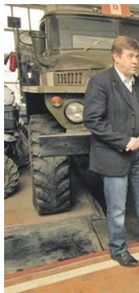
Багаж знаний и навыков в автоделе пригодится в армейской службе.

компьютерные тренажёры. И всё же основные активы автошколы — это умение наставников. Теоретические знания и практические навыки обучаемые