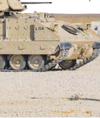
Пентагон, вопреки заявлениям администрации США, сохраняет присутствие в Сирии.

В 2019 году Турция с её внешней политикой оставалась наиболее проблемным Ближнего Востока, понимая существующий там градус напряжённости.