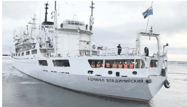
ОИС «Адмирал Владимирский» на пути в Антарктику.

руту «Востока» и «Мирного» следует океанографическое исследовательское судно «Адмирал Владимирский», которое покинуло Кронштадт 3 декабря прошлого года, дав старт масштабной кругосветной океанографической экспедиции Военно-морского флота России, которая посвящена