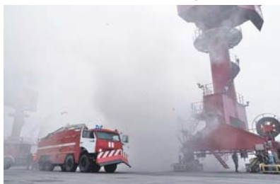
Территория порта Тартуса защищена от диверсии.

Всего с начала процесса урегулирования сотрудниками российского ЦПВС проведено 2339 гуманитарных акций. Общий вес гуманитарного груза составил 393,2 тонны.