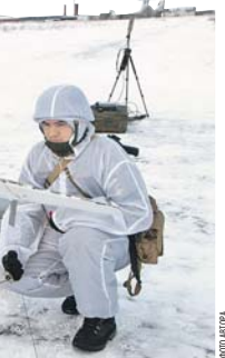
Беспилотник на стартовой позиции.