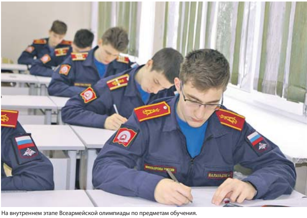
На внутреннем этапе Всероссийской олимпиады по предметам обучения.

— В корпусе созданы основные элементы учебно-материальной базы в соответствии с санитарно-эпидемиологическими требованиями к общеобразовательным учреждениям. Учебно-лабораторная база включает 17