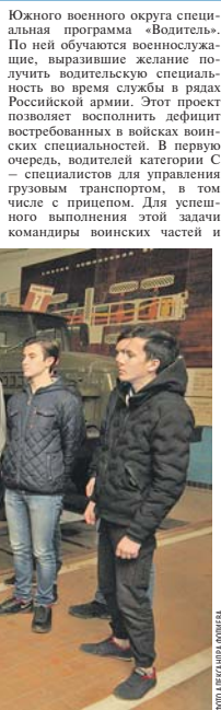
соединений ЮВО тесно взаимодействуют с региональными отделениями ДОСААФ России.

Ещё одно важное направление работы — продолжающаяся уже не первый год в войсках