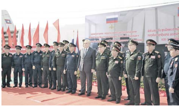
Церемония передачи военной техники.