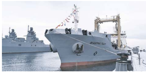
Танкер «Академик Пашин».

судостроительно-судоремонтным заводом. Оснащено судно дизельной одновалной установкой, но-