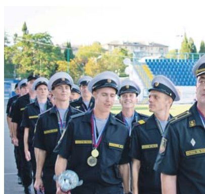
Два года подряд чемпионом Вооружённых Сил по футболу становится команда ЮВО, составленная из игроков севастопольского клуба «Черноморье».