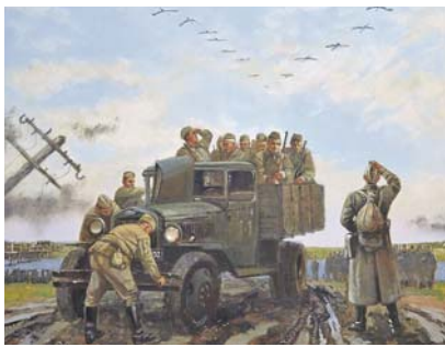
Картина «Летят журавли».

За каждой картиной — своя история. Вот работа «Белый бейдзь. Ту-160». Самолёт стал именем благодаря своей манёвренности и специальной белой окраске. Полотно написано по итогам командировки, проведённой на авиабазе Военно-воздушных сил близ города Ангелса Саратовской области.