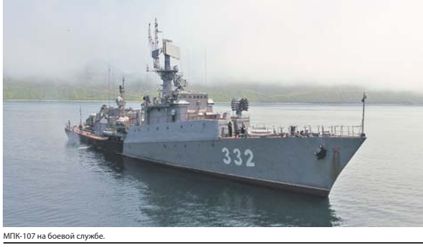
МПК-107 на боевой службе.

позволяет ему решать очень большой спектр задач. В том числе успешно противостоят воздушному и надводному противнику. Что экипаж МПК-107 и продемонстрировал буквально через месяц после