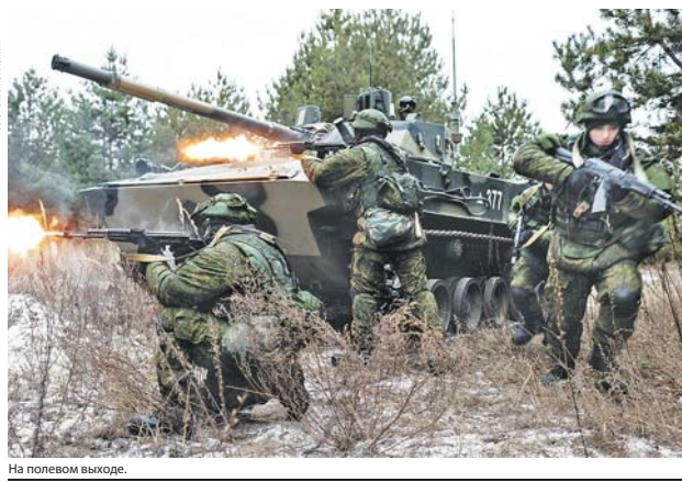
На полевом выходе.