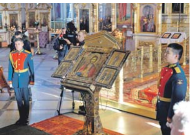
В Вознесенском кафедральном соборе Новосибирска проходит молебен в честь святого благоверного великого князя Александра Невского.

20 января в ночь часов по местному времени на новосибирском аэродроме Толмачёво совершил посадку военно-транспортный самолёт Ил-76 с главной иконой Сухопутных войск — образом Святого Благоверного Великого князя Александра Невского. В сопровождении военной авиационной и отряда военной полиции иконы доставили в Вознесенский кафедральный собор — главный православный храм Новосибирска, где в её честь уже на следующий день состоялось торжественное молебие.