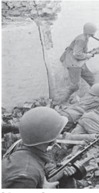
Бой у разъезда Басаргино.