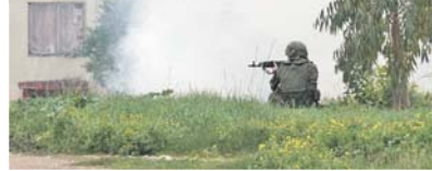
Спецназ отражает вылазки условных террористов.

Инициатором России неформальная встреча Совета Без-