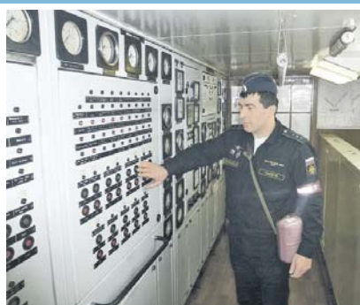
Экипаж трудностей не страшится.

роках. Это на них сказывается не очень хорошо, так как образуются закисленность, нагар. Чтобы всё это выжечь, приходится выводить