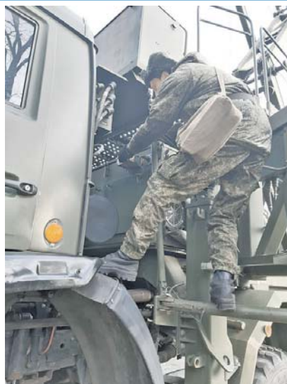
Связисты следуют девизу «Всё выше, и выше, и выше».

Поднятые по тревоге подразделения оперативно выдвинулись в заданный район, развернулись