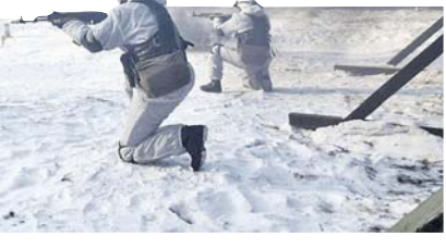
Успокаивающий фактор — глубокий снежный покров.

следствии сожгли кумулятивными гранатами истребители танков — гранатомётчики, вооружённые РПГ-7. Правда, из-за порывов ветра некоторые танки не удалось поразить первыми выстрелами, и воням приходилось в буквальном смысле прислушиваться к