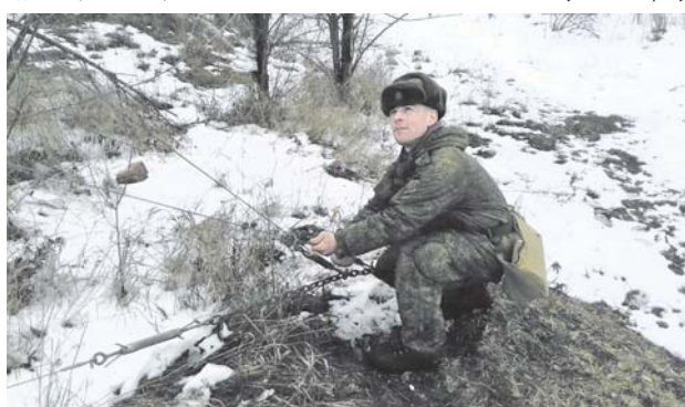
Успех приходит после тренировок и учений.

— У нас сложная современная техника. Во время проверки шпаргалки не помогут — ими попроси-