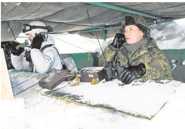
Творческая мысль командира работает постоянно.

противника — дозор в составе трёх БМП. Намерения разведдзора очевидны — установить начертания обороны переднего края мотострелков, расположение по-