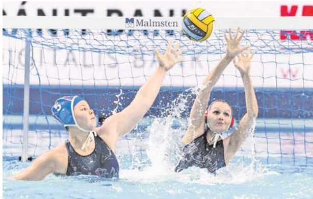
В финале россиянки уступили всего в один мяч — 12:13.

женская сборная России по водному поло стала серебряным призёром чемпионата Европы