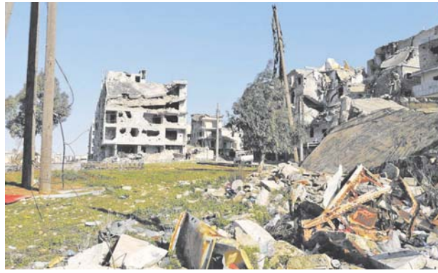
Так выглядят сегодня западные пригороды Алеппо, подвергаемые боевиками обстрелам.

Поэтому жители Халиди, окраинного района города Алеппо, вновь оказались в буквальном смысле на линии фронта. Этот район находится буквально в 200–300 метрах от позиций отрядов экстремистов, которые в январе приняли вновь обострившую многоадресную Халиди. Боевики выжили из неё ещё в 2016 году, жизнь в районе стала постепенно нормализовываться, но, как сейчас выясняется, ненадолго.