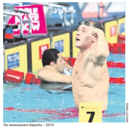
На чемпионате Европы — 2019.