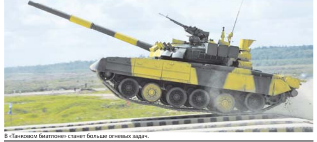
В «Танковом биатлоне» станет больше огневых задач.

принять участие команды Анголы, Белоруссии, Ирана, Киргизии, Конго, Лаоса, Палестины и России.