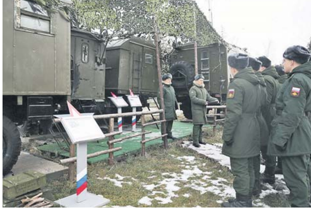
Связисты приближали Победу, как и представители других ратных профессий.