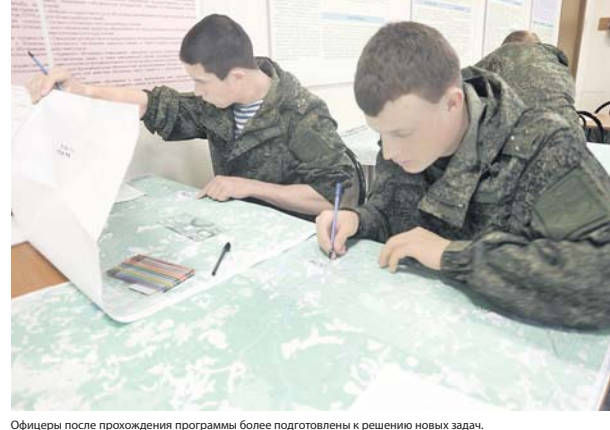
Офицеры после прохождения программы более подготовлены к решению новых задач.

Позже началась основательная подготовка дальневосточниками, когда участники программы в Хабаровске