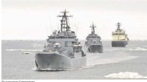
По маршруту Североморья.

не было. Конечно, всё идеальным не бывает, но мелкие неполадки устранялись очень оперативно. В этом заслуга в первую очередь командиров электромеханических боевых частей и старшин команд, которые грамотно руководили действиями своих подчинённых. Собственно, они не только управляют, но и не стеснялись загорячаться, выжывая и