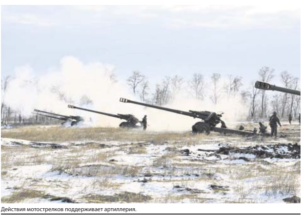
Действия мотострелков поддерживает артиллерию.

действия мотострелков поддерживает артиллерию.