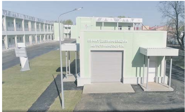
Центр в Новосибирске.

Вообще, врачбно-сестринский состав прибыл на объект во все медцентры, чья работа уже стартовала. В числе сотрудников — высококвалифицированные специалисты, в том числе инфекционисты, пульмонологи, анестезиологи и рентгенологи, которые прошли обучение и повышение квалификации на базе Военно-медицинской академии имени С.М. Кирова в Санкт-Петербурге. Всего работ медцентров будут обеспечивать 400 военных врачей,