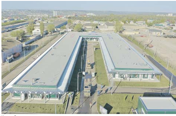
Центр в Волгограде.

В Уссурийске медцентр построен на территории 439-го военного госпиталя — старейшего на Дальнем Востоке. Он был основан в 1882 году и в разное время здесь практиковали выдающиеся врачи — С.П. Боткин, А.А. Вишневский, С.С. Зимницкий, Н.М. Амосов. Многие из зданий госпиталя являются памятниками архитектуры конца XIX — начала XX веков. Новое строительство не велось здесь достаточно давно.