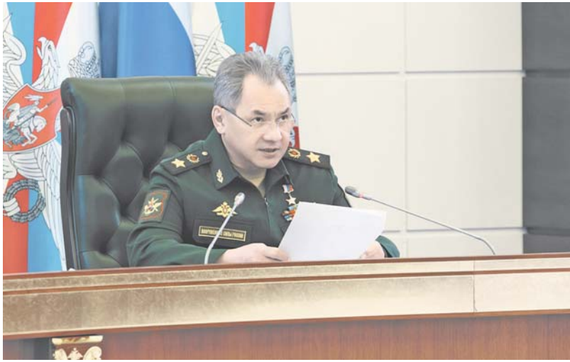
ФОТОГРАФИЯ СЕРГЕЯ ШОЙГУ

Кроме того, для своевременного лечения инфекционных больных к развертыванию готовы семь мобильных подразделений на 700 мест. Под эти задачи выделено 86 военно-врачебных бригад. В числе экстренных мер Сергей Шойгу также отметил, что на госпитальном судне «Иртыш» развернуто 450 мест под размещение неинфицированных пациентов, чтобы разгрузить госпитали Министерства обороны на Дальнем Востоке