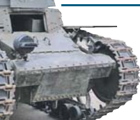
МС-1 сошел с постаментов парада в 2015 году.