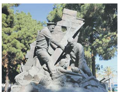
Этот памятник в Мессине напоминает о героизме русских моряков, которые первыми протянули руку помощи пострадавшим от землетрясения жителям Италии.

Этот подвиг читат и помнит здесь до сих пор, несирая по прошедшее столетие. В память о трагических событиях тех дней и как знак благодарности за оказанную помощь в борьбе с разбухавшей стихией на острове Сицилия семь лет назад, осенью 2013 года, появились плащиды Русских моряков.