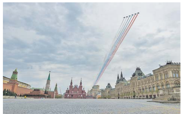
Схема пролёта авиации 9 Мая над Москвой и другими городами России размещена на официальном сайте Министерства обороны РФ и в сегодняшнем номере «Красной звезды».

ний вариант воздушного парада. Генеральная репетиция демонстрационного пролёта планируется в 10 часов 7 мая в зависимости от погодных условий. В День Победы 9 мая авиация пролетит над городом-героем Мурманском также в 10 часов.