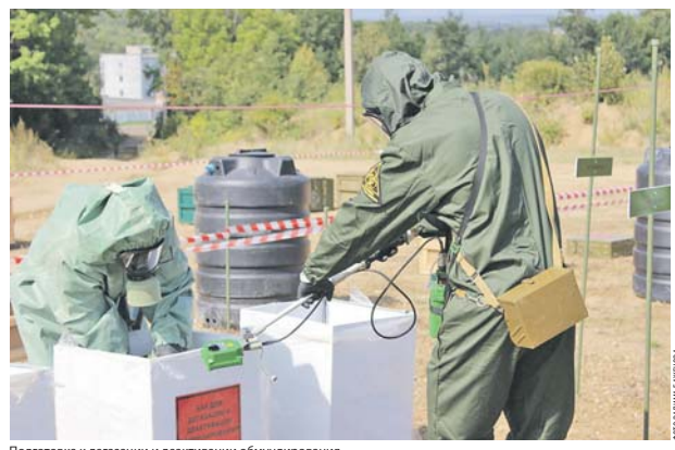
Подготовка к дегазации и деактивации обмундирования.

В целях комплексной квалифицированным специалистам multifunctional medical centers, которые уже возведены в Уссурийске, а также в эти дни возводятся в селе Анастасьевка под Хабаровском, Петро-