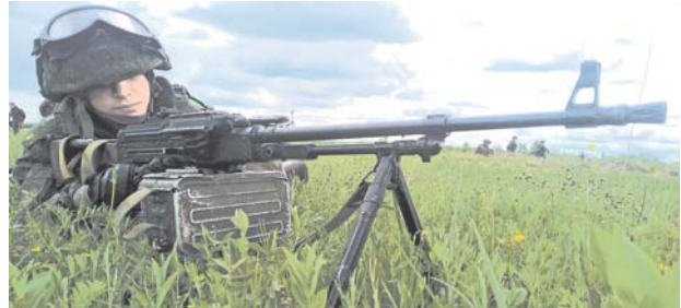
Тактические нормы и упражнения отрабатываются в полевых условиях.