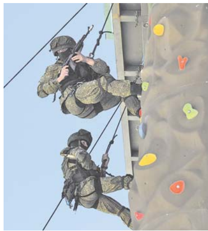
На скалодроме тренировки проходят по-боевому.

На фоне молодых ребят сорокачеленлетний сержант выделялся «дедом». Впрочем, именно так