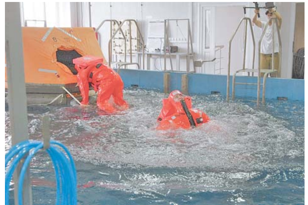
В условиях, максимально приближенных к реальным.