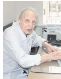
А отдыхать нам рановато.