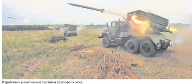
В действии реактивные системы залпового огня.