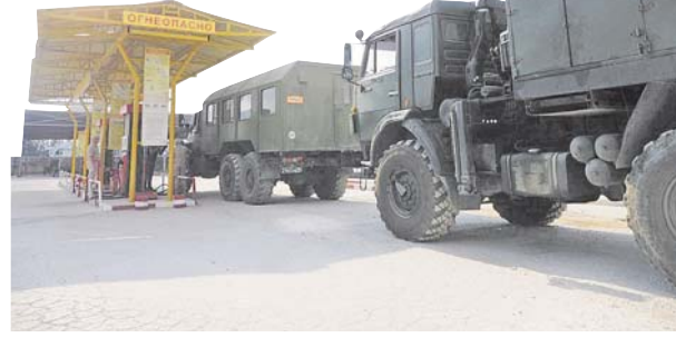
Одно из самых важных подразделений МТО на авианаве — склад ГСМ. Десятки автомобилей ежедневно приезжают на склад для того, чтобы заправиться топливом.

журство несколько пожарных команд, готовых выехать на тушение возгорания в течение 20 секунд. В профессионализме бойцов местной пожарной охраны можно не сомневаться — выезды по учебным тревогам у них проводятся регулярно и всегда показывают, что военные укладываются по нормативам. Сопоставляет этому и безотказная современная техника.