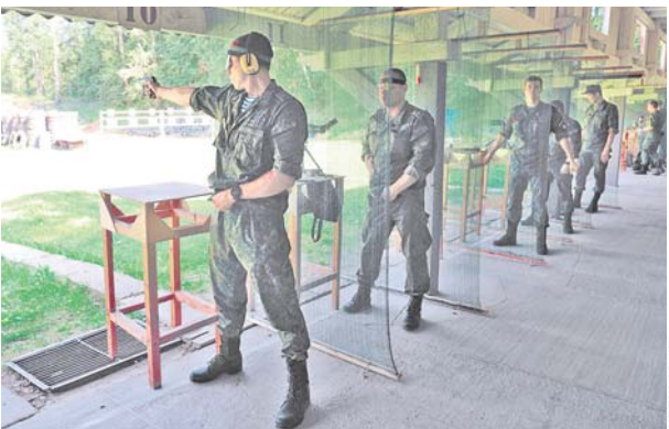
На рубеже – мастера стрельбы из пистолета. Результаты стрельбы каждого участника определяются по сумме выбитых очков в мишень зачётных серий или по сумме пробоин в зачётных мишенях.