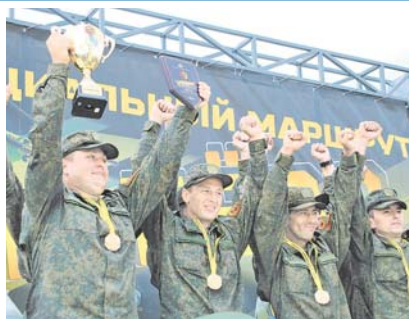
В ходе проведения конкурса были установлены новые рекорды в прохождении препятствий и выпол-