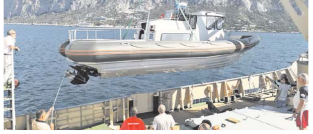
Спуск катера на воду.

Погодные условия вносили коррективы в план проведения экспедиции. Сильный ветер и волнение моря серьёзно осложняли работу спецнастов. Тем не менее в ходе поисковых мероприятий осуществлён подъём зенитной пушки «Эрликон» одного запущенного самолёта к ней, множества фрагментов другой военной техники.