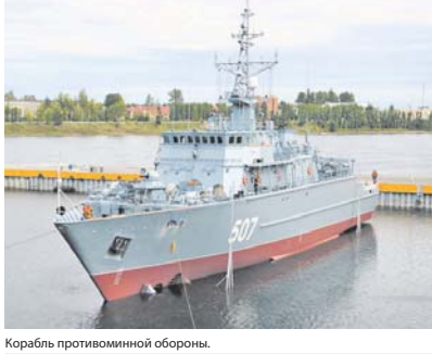
Корабль противоминной обороны.

Проект 12700 «Александрит» разработан Центральным морским конструкторским бюро «Алмаз» (входит в Объединённую судостроительную корпорацию) для ВМФ РФ. Эти корабль относятся к новому поколению минно-тральных сил и предназначены для борьбы с морскими минами, которые новые корабли ПМО могут обнаруживать как