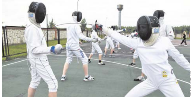
Фехтовальщики работали над техникой и тактикой ведения боя.