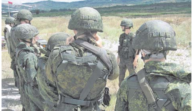
Прислушиваться к солдату — одно из главных правил командира.