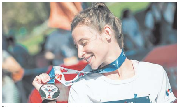
Проверить свои силы на дистанции мог каждый желающий.

2 августа в России прошёл крупнейший в мире забег с синхронным стартом в 85 городах