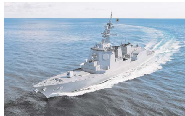
Эсминец Maya (DDG-179). В 2021 году морские силы самообороны Японии будут располагать в эсминцами УРО трёх типов, оснащённых зенитными ракетами SM-3 и способными решать задачи ПРО.

Что касается альянса, то сегодня, когда Вашингтон всё больше вытесняется в открытое противостояние с Пекином, их союз нарастает на сдерживание «растущего влияния» западного соседа в Азиатско-Тихоокеанском регионе. Правда, полное единение между бывшими противниками по Второй мировой войне, а сегодня близкими союзниками не наблюдается. С приходом Дональда Трампа в Белый дом возобновились споры о расходах по содержанию американского контингента на Японских островах. В Вашингтоне ныне считают, что за защиту Страны восходящего солнца должны платить японский, а американский налогоплательщик.