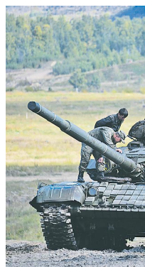
Танки выходят из-под воды.

Буквально 9 Мая 2020 года, в годовщину 75-летия Победы, в Казанском высшем танковом командном Краснознаменном училище. А раньше служил в