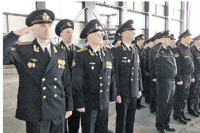
Готовы к новым задачам.

сленные голы баз на Севере. Точнее сказать, восстановление гарнизона, действовавшего ещё в советский период. Сейчас, когда снова развёрнуты базы на аэродроме Шмидта и острове Врангеля, в Тикси, там «ожил» и военный гарнизон, куда транспортируют Ан-12 доставляют различные грузы, личный состав, технику. Экипажи транспортных лодок составляют все необходимое для