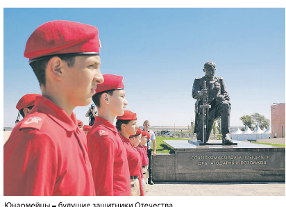
Юнармейцы — будущие защитники Отечества.

На донской земле, приближая Великую Победу, плечом к