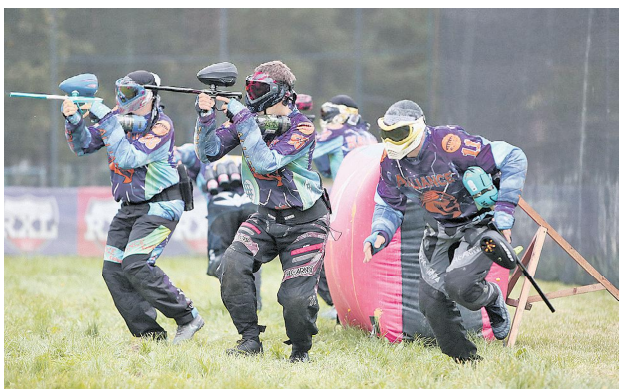
Пейнтбол — популярная военно-спортивная игра.

Хава). Коллектив «Музы» (Санкт-Петербург) занял четвёртое место. В 1-м дивизионе (юноши до 19 лет) турнира «Золотой Шар» победу одержала команда