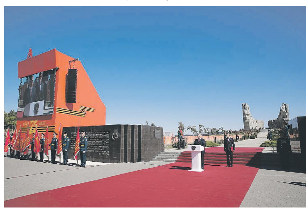
Церемония открытия военно-исторического музейного комплекса «Самбские высоты».