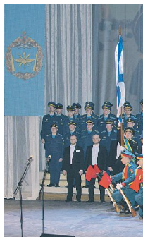
На сцене — хор Военно-воздушной академии имени профессора Н.Е. Жуковского и Ю.А. Гагарина.