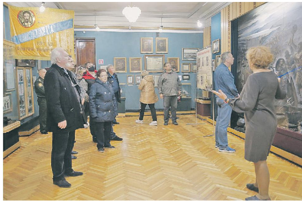
В военно-историческом музее ВВО.