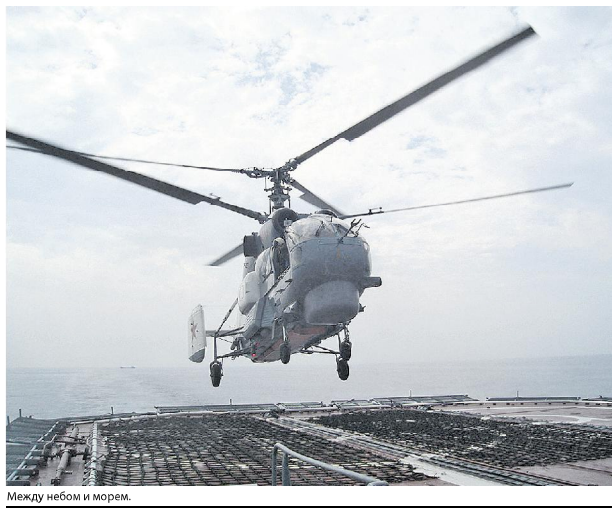
Между небом и морем.

воинских частей и на Сахалин, Камчатку, Курилы, в Хабаровский край.