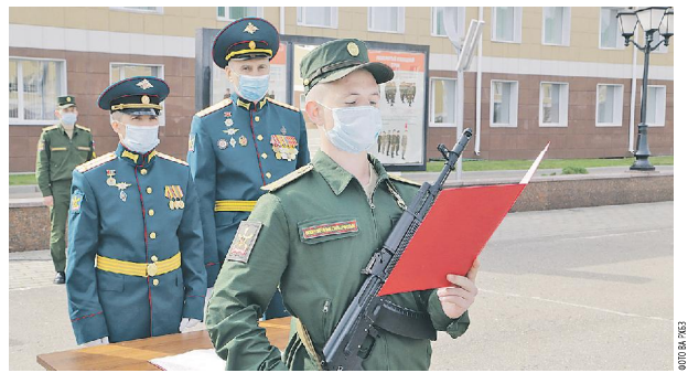
Первый шаг к офицерской мечте.

Сотни клятв на верность Отечеству прозвучали в Военной академии радиационной химической и биологической защиты имени Маршала Советского Союза С.К. Тимошенко