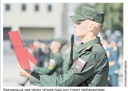
Уже меньше чем через четыре года они станут лейтенантами.