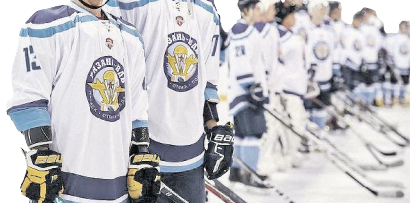
Команда «Рязань-ВДВ» вскоре стартует в первенстве Национальной молодежной хоккейной лиги.

Матч прошёл в дружелюбной атмосфере: в нём не было ни одного гола.