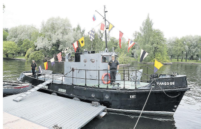
Учебно-гребная база готова к эксплуатации после модернизации.

В городе на Неве на территории Санкт-Петербургского государственного морского технического университета в один день состоялось торжественное открытие двух объектов, важных для совершенствования физической подготовки молодежи. Знаменитый Корпус морской пехоты, ставший комплексом с плавбазой, учебным и бассейном, а также учебно-гребной базой.