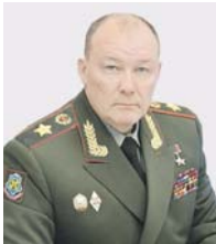
Генерал армии Александр ДВОРИНОВ.

— Вот уже не первый год в войсках верного вам военного округа сотни подразделений демонстрируют высокие показатели по различным направлениям служебной деятельности — от боевой подготовки до образованного состо-