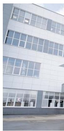
Прходная Ижевского механического завода (входит в ГК «Калашников»).

прежнему производится в рамках ОКР «Ратник». Его проверка межведомственная комиссия. Также автомат проходит полноконтрольную эксплуатацию в ВДВ, Сухопутных войсках. Уже за время серийного производства и поставок АК-12 «Калашников» направлял представителей в де-