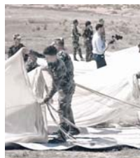
Доставка гуманитарной помощи.

в населённом пункте Нава провинции Хомс проведена гуманитарная акция, в ходе которой местным жителям доставили 500 предметов первой необходимости, общим весом 4,7 тонны.