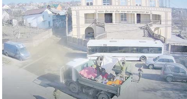
У синагоги в городе Умань украинские неонацисты в кузове самосвала маскируют оружие и боеприпасы. Рядом — школьный автобус в их распоряжении.

На момент подготовки материала к публикации подразделения российских Вооружённых Сил Луганской Народной Республики продолжали наступательные действия на окраинах Северодонецка, продвинувшись за день вглубь обороны 57-й отдельной мотопехотной брига-