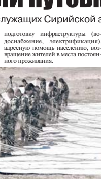
Иллюстрация к статье.

американскому обществу, доказать, что обостряющийся в их стране глубокий экономический кризис, по своим масштабам сравнимый с Великой депрессией 1929 года, связан с тем, что Соединённые Штаты противостоят России. Хотя на самом деле они сами косвенно участвуют в управлении экономикой и довели её до состояния, когда дальше она уже не может развиваться за счёт