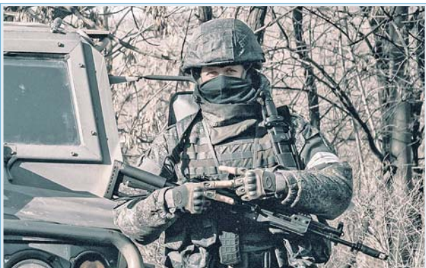
Российские военнослужащие, выполняющие задачи специальной военной операции, знают, что по всей стране и за её пределами проходят масштабные акции в их поддержку. Воицы искренне благодарят за тёплые слова и передают огромный привет на Родину. Всё обязательно будет хорошо!

«Разговор получился обстоятельным, патриотическое воспитание