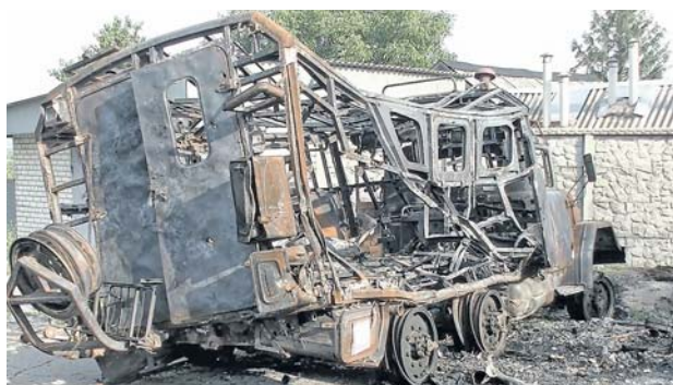
пункте Анновка Кировоградской области — хранилище топлива для военной техники.

Оперативно-тактическая и армейская авиация, ракетные войска и артиллерия за сутки нанесли поражение 22 пунктам управления. В том числе — 98-го батальона 108-й бригады территориальной