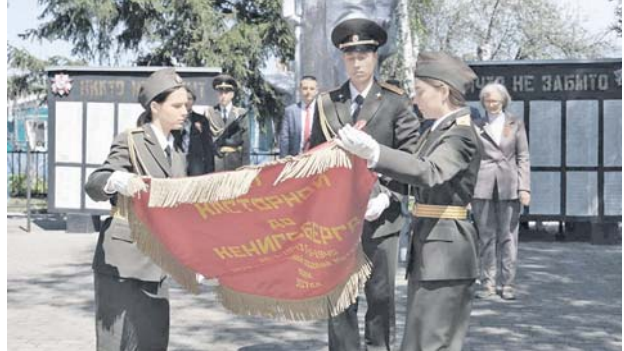
Брянский музей получил копию Боевого пионерского знамени.

Корреспондент газеты «Красная звезда» Илья Эренбург в одной из своих публикаций назвал Касторное малым Сталинградом. Каждый дом приходилось брать с боем. Во время проверки одного из освобождённых зданий бойцы 1023-го стрелкового полка наткнулись на старое полотнище помеченное. Как оказалось, пилотеры так разместили вековой