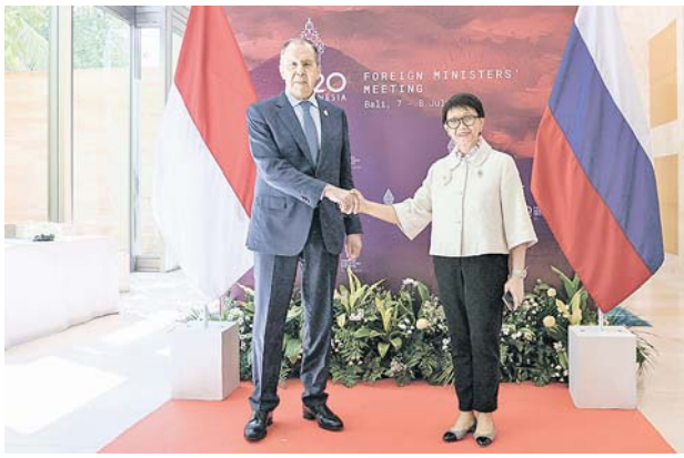
Министр иностранных дел РФ Сергей ЛАВРОВ и министр иностранных дел Индонезии Ретно МАРСУДИ во время встречи в рамках заседания глав МИД стран «Группы двадцати», 8 июля.

В выступлении Сергея Лаврова были изложены базовые подходы к наращиванию межгосударственного сотрудничества на равноравной основе с опорой на Устав ООН и международное право, эффективное использование потенциала «Группы двадцати» в качестве репрезентативного социально-экономического форума. В свете искаженной трактовки Запада событий на Украине подробно объяснены причины кризиса в этой стране по следам госу-