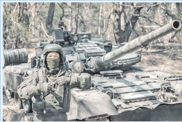
Российские военнослужащие, выполняющие задачи специальной военной операции, знают, что по всей стране и за её пределами проходят масштабные акции в их поддержку. Бойцы искренне благодарят за тёплые слова и передают огромный привет на Родину. Всё обязательно будет хорошо!