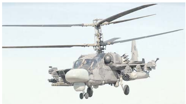
бомбы массой 250 килограммов или две по 500 килограммов. А также вооружил противотанковыми ракетными комплексами «Вихрь» с дальностью поражения

Ми-8АМТШ, как многоцелевой вертолёт, используется для высадки десанта и его огневой поддержки, уничтожения танков и иной техники противника, транспортировки боеприпасов и других грузов, при поисково-спасательных работах и эвакуации раненых. Главная особенность Ми-8АМТШ, отличающая его от иных версий «восьмёрки», — вооружение. Помимо двух 7,62-мм пулемётов ПКП, на вращающемся хвосте подвески в зависимости от характера выполняемых задач можно установить ПТУР «Штурм-В» или «Атака», блоки НАР с 80-мм ракетками С-8, контейнеры со снарядами 23-мм пушечной ГШ-23, повесить четыре авиа-