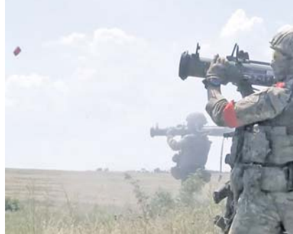
Березнеговатое Николаевской области в результате огневого поражения позиций 99-го механизированного батальона 61-й пехотной егерской бригады ВСУ уничтожено свыше 75 националистов и около 30 единиц бронетанковой и автомобильной техники.

В районах населённых пунктов Першотранное Днепропетровской области, Бакмутское и Серск Донецкой Народной Республики уничтожены пять складов боеприпасов, а в населённом