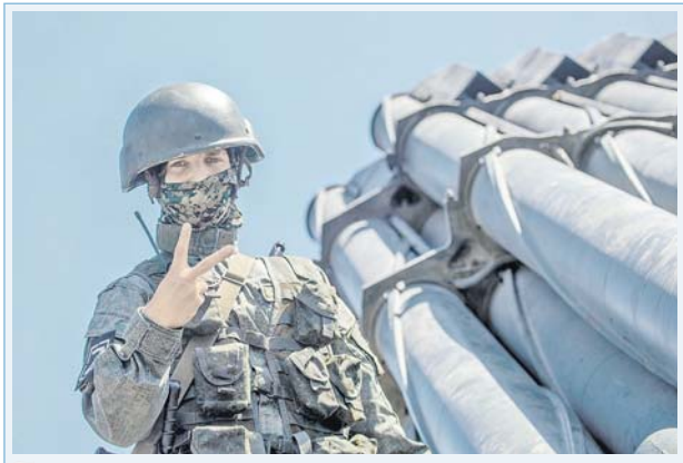
Российские военнослужащие, выполняющие задачи специальной военной операции, знают, что по всей стране и за её пределами проходят масштабные акции в их поддержку. Боицы искренне благодарят за тёплые слова и передают огромный привет на Родину. Всё обязательно будет хорошо!

Военнослужащие Вооружённых Сил России, принимающие участие в специальной военной операции, ощущают постоянную поддержку со стороны подавляющего большинства россиян