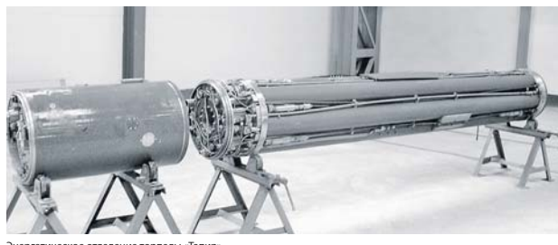
Энергетическое отделение торпеды «Тапир».

установок замкнутого цикла до уровня хода 1500 м и скоростей хода до 90 узлов.