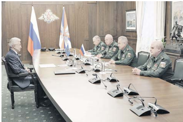
В ходе встречи были обсуждены актуальные вопросы развития военной составляющей организации и совершенствования её силового потенциала.

Сергей Шойгу поздравил Имангали Тасмагамбетова с назначением на должность. Он также выразил надежду на то, что опыт Имангали Тасмагамбетова послужит дальнейшему укреплению