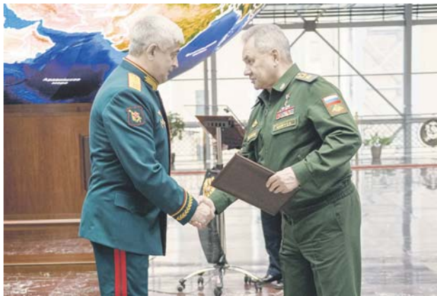
Торжественная церемония вручения новых высших офицеров воинскими званиями Вооружённых Сил России прошла 20 февраля в Национальном центре управления обороной Российской Федерации.

Ряду высших и старших офицеров, которым Указом Президента Российской Федерации присвоены очередные воинские звания, вручены новые погоны