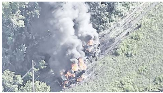
В районе населённых пунктов Харькова и Ровнополя ДНР уничтожены штабы 10-й горно-штурмовой и 60-й механизированной бригады ВСУ