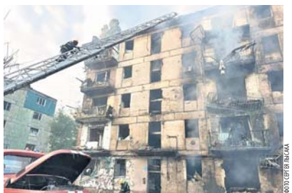
Разрушенный дом в Кривом Роге.

Однако и это не помогло, в исходном видео артикуляция гораздо лучше совпадает со звуковой дорожкой, а фальшивый ролик кадрирован, вследствие чего имеет худшее качество. Кроме того, несмотря на попытку фейкомётов имитировать кавказский акцент в озвучке, можно расплыть фразировку «г» (похоже на «х»), характерное для речи жителей Украины.