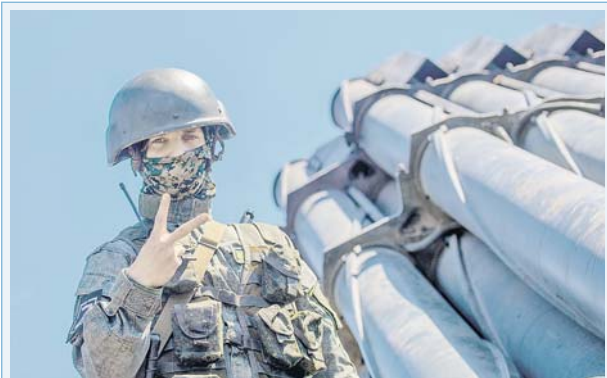
Российские военнослужащие, выполняющие задачи специальной военной операции, знают, что по всей стране и за её пределами проходят масштабные акции в их поддержку. Бойцы искренне благодарят за тёплые слова и передают огромный привет на Родину. Всё обязательно будет хорошо!

«Женский голос поддержки специальной военной операции должен звучать громко!» — так решили участницы общественных организаций, неравнодушные жительницы Камчатки. Они объединили усилия с работой властей муниципалитетов и правительства края и получили необходимый результат. Опираясь на главных участников съезда стали представителями регионального штаба Комитета семей воинов Отечества, созданного на базе женского Камчатского отдельной бригады морской пехоты. Решение