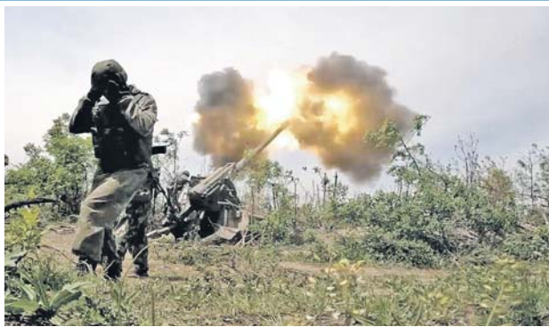
Тылом просит защитники Родины — таким образом они выказывают свою признательность мужинам и поддерживают их всеми силами.

Добровольцы рассказали о своей службе, атаке попросили доставлять больше зарплатных устройств, подчеркнуть, что помощь землякам полезна. Например, общественники отправили военнослужащим макроскопические сети, оконные свечи и другие вещи, о ко-