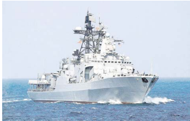
В акваториях Японского и Охотского морей группировки сил Тихоокеанского флота в дальней морской зоне в соответствии с планом учения отработывали дей-

Участие отряда кораблей ТОФ в международном учении прошло в рамках выполнения задач дальнего похода в Азиатско-Тихоокеанском регионе.