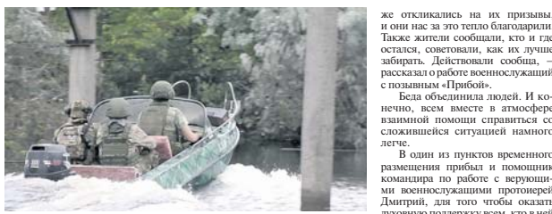
После подрыва в первую очередь занимались эвакуацией населения из затопленных районов. А для тех, кто по разным причинам не захотел уехать, организовали доставку продуктов питания и питьевой воды», — сказал он.

Для дезинфекционных мероприятий использовались специальные авторазливочные станции АРС-14КМ. Они предназначены для дезинциации и дезинфекции вооружения и военной техники, отдельных участков местности и дорог, временного хранения и транспортирования вооружения и боеприпасов, снаряжения или различных ёмкостей и ком-