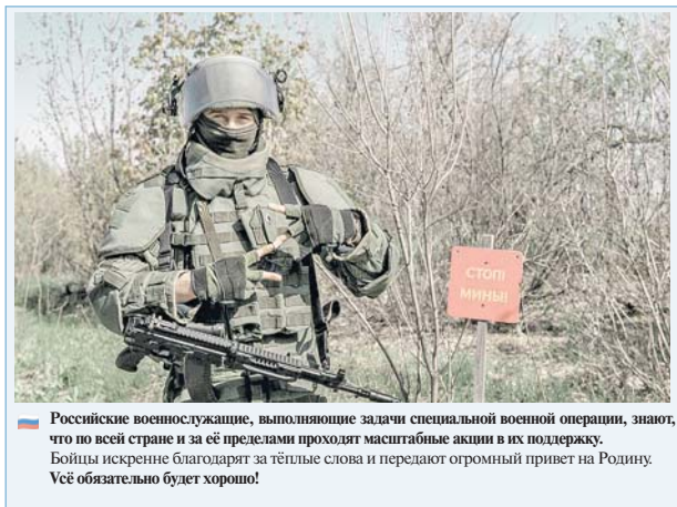
Российские военнослужащие, выполняющие задачи специальной военной операции, знают, что по всей стране и за её пределами проходят масштабные акции в их поддержку. Бойцы искренне благодарят за тёплые слова и передают огромный привет на Родину. «Всё обязательно будет хорошо!»