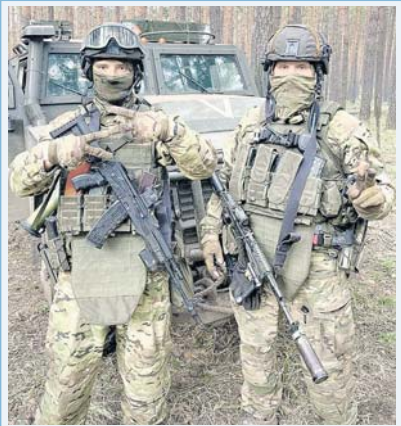
Российские военнослужащие, выполняющие задачи специальной военной операции, знают, что по всей стране и за её пределами проходят масштабные акции в их поддержку. Бойцы искренне благодарят за тёплые слова и передают огромный привет на Родину. Всё обязательно будет хорошо!

Много писем и открыток отправляют в зону СВО не только родные и близкие защитников Отечества, но и совершенно незнакомые им люди. Особенно трогательны послания от детей, в которых они благодарят военных за защиту и просят бойцов поскорее возвращаться домой живыми и здоровыми. Вот одно из таких писем: «Здравствуй, незнакомый солдат! Я ученица 8-го класса. И хотя не знаю тебя лично, восхищаясь тобой, потому что твой служба очень интересна и важна для нашей страны. Ты смелый и сильный, я это знаю. За твоей спиной тысячи соотечественников, которые рассчитывают на твою защиту. И себя, конечно, ведь тебе нужны силы, чтобы справиться с трудностями, которые встретятся на военном пути. Желаю тебе, солдат,