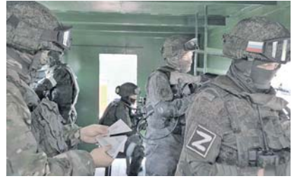
СВО, так и на передовой. Почту развозят всеми видами транспорта, а если адресаты располагаются у линии огня, то и на бронемашинах. В зоне проведения СВО не всегда есть возможность созвониться с родственниками, по-

Через станции и обменные пункты ФПС ежедневно проходят