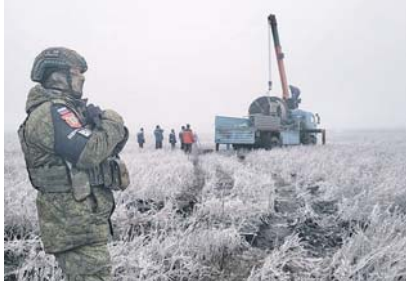
отметил собеседник, успешно справляется, состоит в том, чтобы закрепить и приумножить доверие местных граждан к Вооружённым Силам РФ.

Однако основная задача при взаимодействии с населением, с которой военнослужащие, как