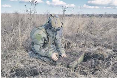
планы переоснащают представителем военной комендатуры уличной и эффективной работой.

Такие недоброжелатели пытаются наводить и корректировать огонь артиллерии противника, дроны, причём не только на позиции российских войск, но и на объекты гражданской инфраструктуры, воздвигая на военно-гражданскую администрацию Запорожской области. Эти