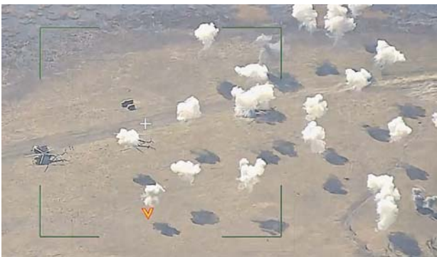
Уничтоженные вертолёты ВСУ.

На авдеевском направлении подразделения группировки войск «Центр» активными действиями улучшили положение в переднем крае и отразили 12 контратак штурмовых групп 47-й механизированной, 3-й штурмовой и 78-й десантно-штурмовой бригад ВСУ в районах населённых пунктов Новоивановка, Коровинское, Оровка и Тоньеское Донецкой Народной Республики. Нанесено огневое поражение живой силе и технике 23-й и 24-й механизированных бригад ВСУ в районах населённых пунктов Новоивановка, Коровинское, Оровка и Ленинское Донецкой Народной Республики. Противник потерял до 460 военнослужащих, танк, три ко-