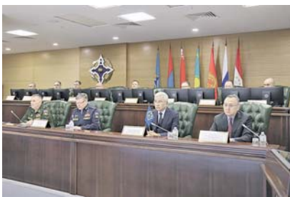
Будут комплексных подходов для их разрешения», — указал он. По его словам, одной из важнейших целей тренировки является