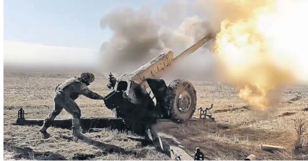
После выполнения огневых задач артиллеристы маскируют орудия и укрываются в блиндажах.

Специалисты ПСО готовы в считанные минуты произвести эвакуацию экипажа при возникновении негативной ситуации.