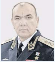
Врио главнокомандующего Военно-Морским Флотом России адмирал Александр МОИСЕЕВ

Средствами противовоздушной обороны уничтожены 143 украинских беспилотных летательных аппарата, а также сбиты 38 реактивных снарядов систем залпового огня: HIMARS, «Оплэ», «Град» и Vampire.