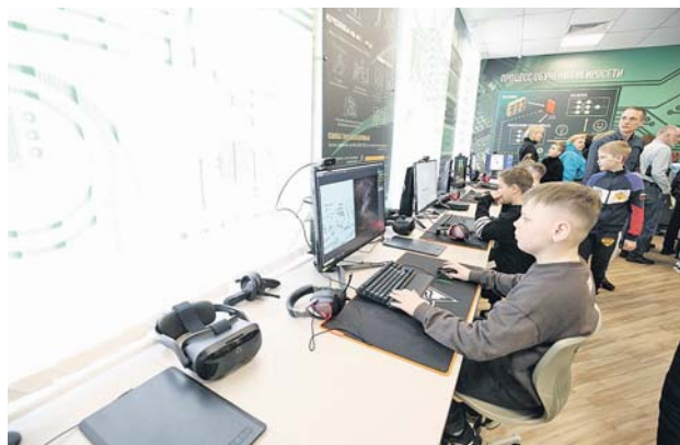
Фото Тверского СВУ Тверь

Как бы ни сложились дальнейшая судьба этих подростков и их сверстников, этот день, проведенный в стенах легендарного училища, они запомнят надолго, возможно, на всю жизнь.