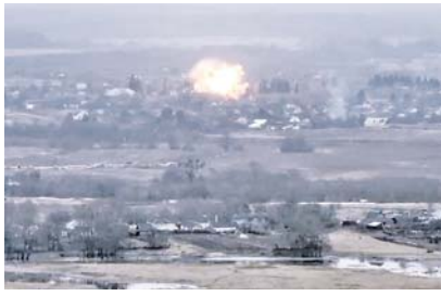
Уничтожение диверсионно-разведывательной группы украинских формирований в приграничном районе Курской области.

На ждоловском направлении подразделения группировки войск «Восток» заняли более выгодные