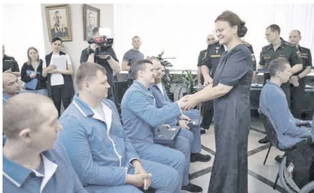
1 стр. →

По организованному каналу связи были оперативно уточнены задачи инженерным подразделениям по восстановлению участка дороги, а также переданы координаты расположения сил националистов, на основании которых по врагу был нанесён ответный артиллерийский удар. Повреждённые участки трассы были восстановлены, что позволило обеспечить продвижение российских войск.