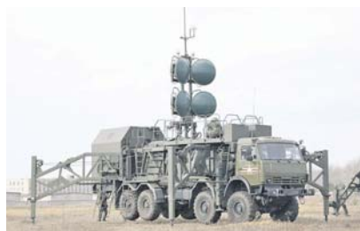
участие около 40 военнослужащих, были задействованы командно-штабные машины, радиорелейные станции связи, портативные станции спутниковой связи.

ми полных команд осуществлялась подготовка тактического поля, автодрома, танкодрома, мест для стрельбы из боевой техники и вооружения.