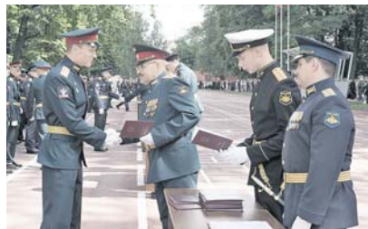
инскому и врачебному долгу всегда будут востребованы на благо нашей Родины.