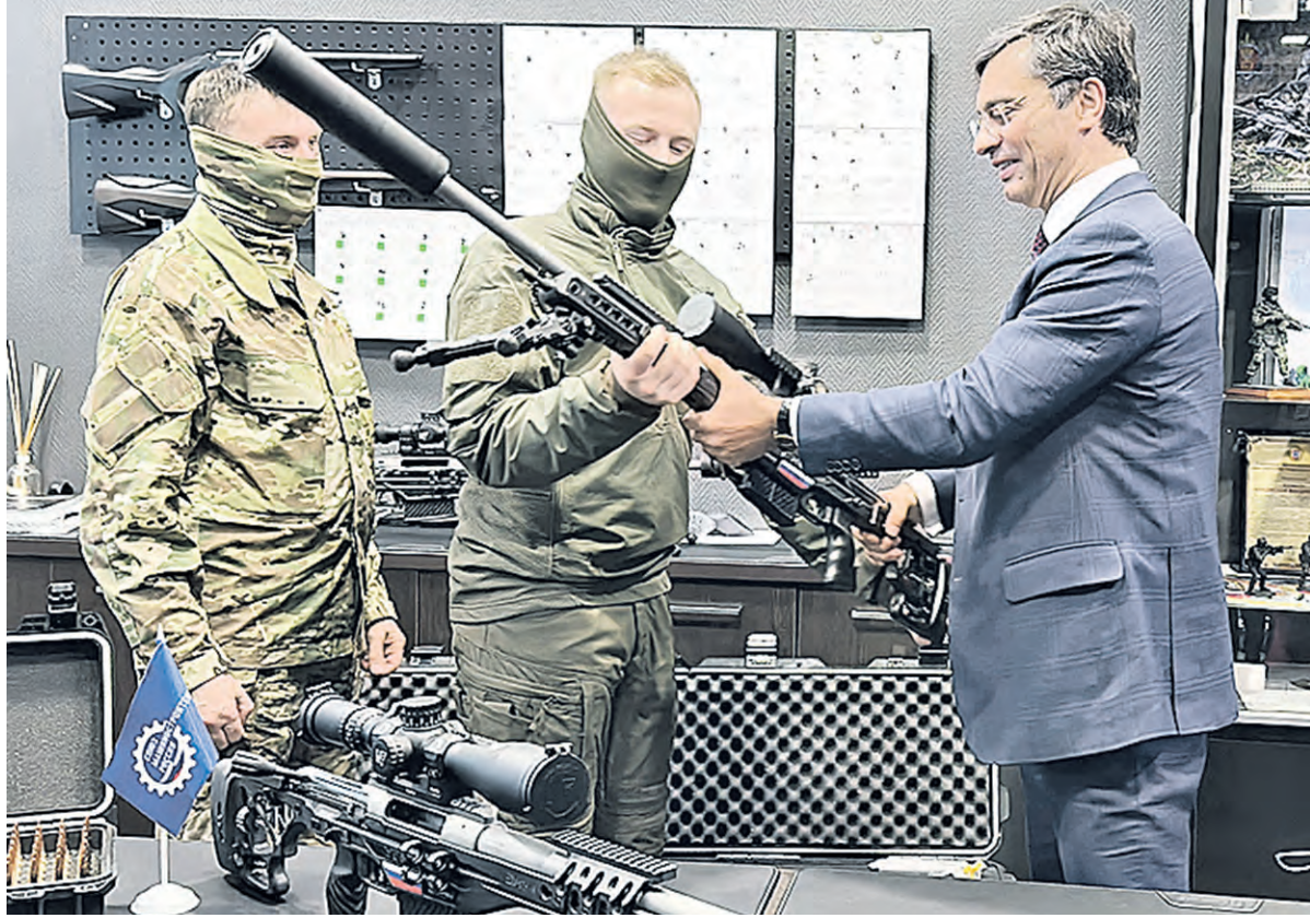
Президент Лиги содействия оборонным предприятиям Владимир ГУТЕНЕВ вручает участникам СВО снайперские комплексы, созданные по индивидуальному заказу.

— Несмотря на санкции и международное давление, ОПК продолжает наращивать военную мощь для успешного выполнения задач как на внешнеполитической арене, так и в