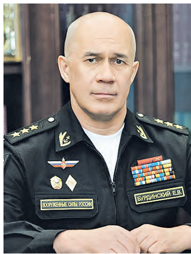
Генерал-полковник Евгений БУРДИНСКИЙ.

— Необходимо отметить, что наше внимание уделяется не только вопросам нормативного и методического обеспечения деятельности военных комиссариатов, но и мате-