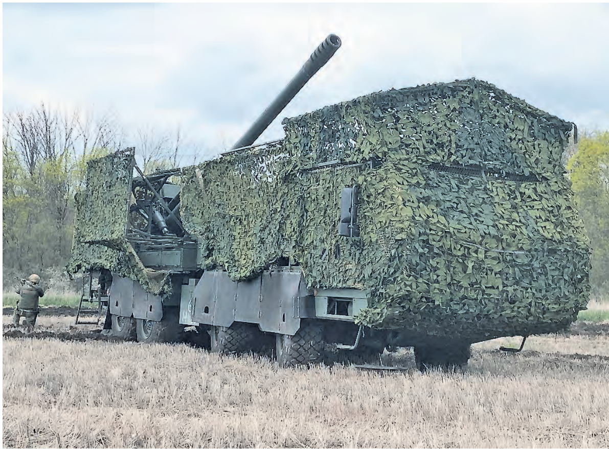
Его товарищ по расчёту старший наводчик с позывным «Раша» согласен с сослуживцем. Он, как и все в этом расчёте, за-

— Конечно, поначалу приходилось притираться. Но теперь могу сказать, что мы сдружились. Я привык. Машина манёвренная, надёжная. Конечно, чтобы она не подводила, за ней нужно ухаживать — что-то вовремя ме-