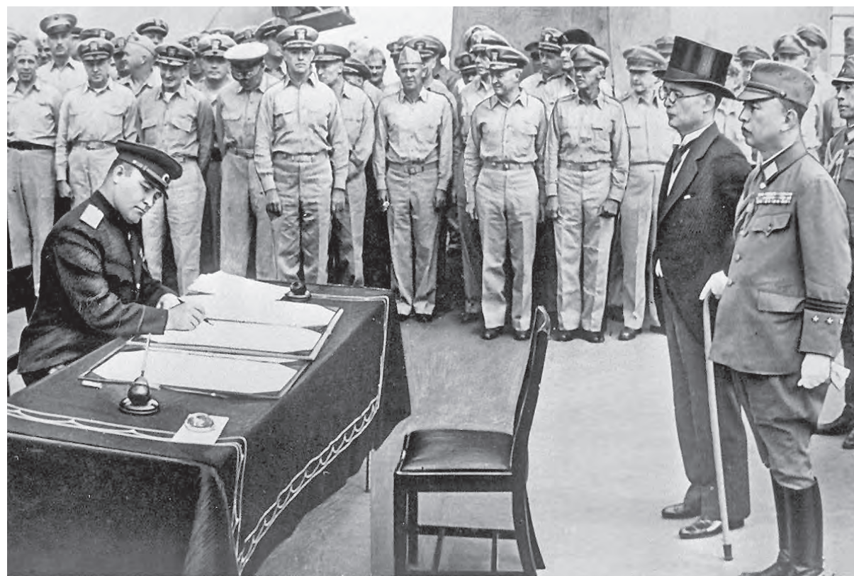
Генерал-лейтенант К.Н. ДЕРЕВЯНКО от лица СССР подписывает акт о капитуляции Японии на борту линкора «Миссури», 2 сентября 1945 года.

Так что напрасно современные японские историки и пропагандисты пытаются утверждать, что Мацуока был в этой позиции в одиночестве, проявлял свою эксцентричность и завывшенное